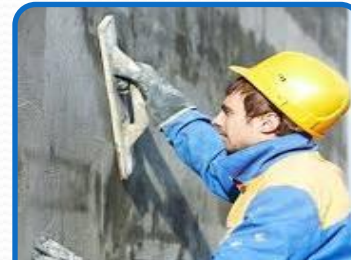
Работники строительной сферы