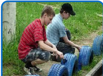
Подсобные рабочие на местах