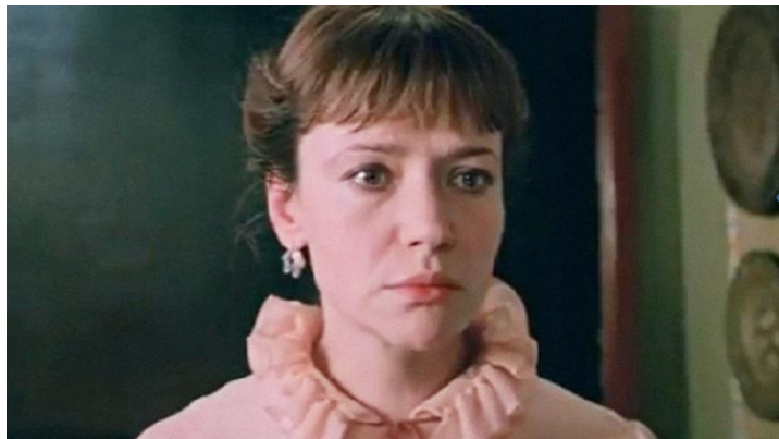
«Чучело» (1983 г.)

Образы учителей, не умеющих вовремя заметить проблемы или недостатки учеников.