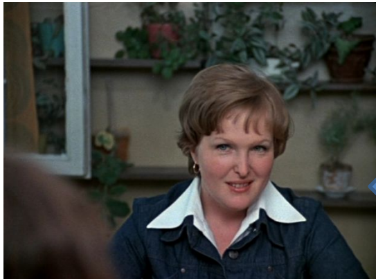
«Уроки французского» (1978 г.)

Лидия Михайловна — молодая учительница, которая, узнав о трудностях ученика, пытается решить их небольшой хитростью, рискуя при этом своей работой.