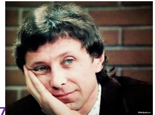
«Расписание на послезавтра» (1977 г.)