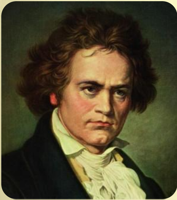
БЕТХОВЕН ЛЮДВИГ ВАН (1770-1827)

Великие перевороты, революции и военные противостояния, произошедшие в Европе, нашли свое отражение в творчестве композитора. Он воплотил в музыке картины героической борьбы. В бессмертных произведениях Бетховена можно услышать борьбу за свободу и братство людей, непоколебимую веру в победу света над мраком, а также мечты о свободе и счастье человечества. Один из самых известных и удивительных фактов его жизни – болезнь ушей переросла в полную глухоту. Но несмотря на это композитор продолжал писать музыку. Он также считался одним из лучших пианистов.