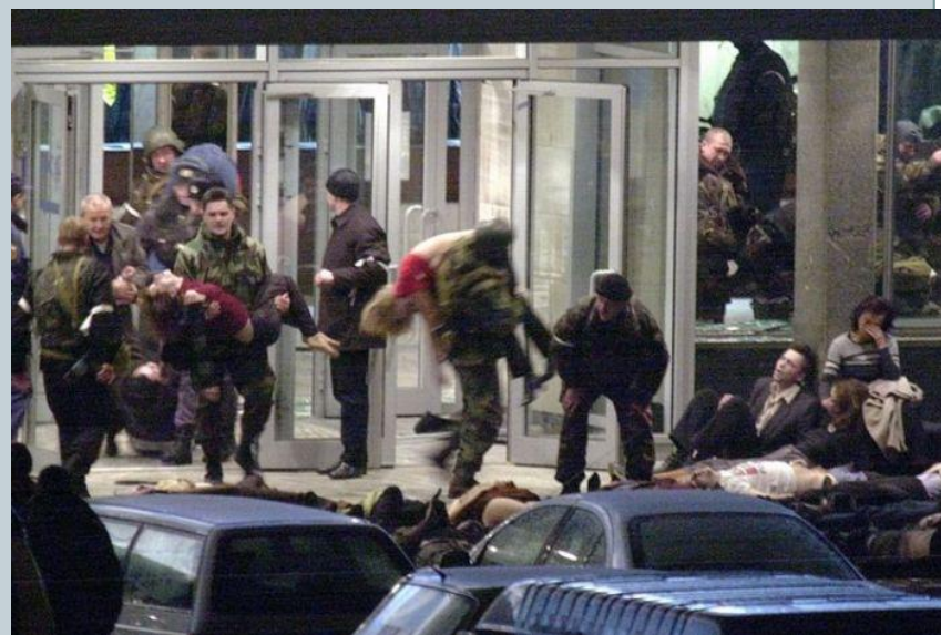
Теракт на Дубровке