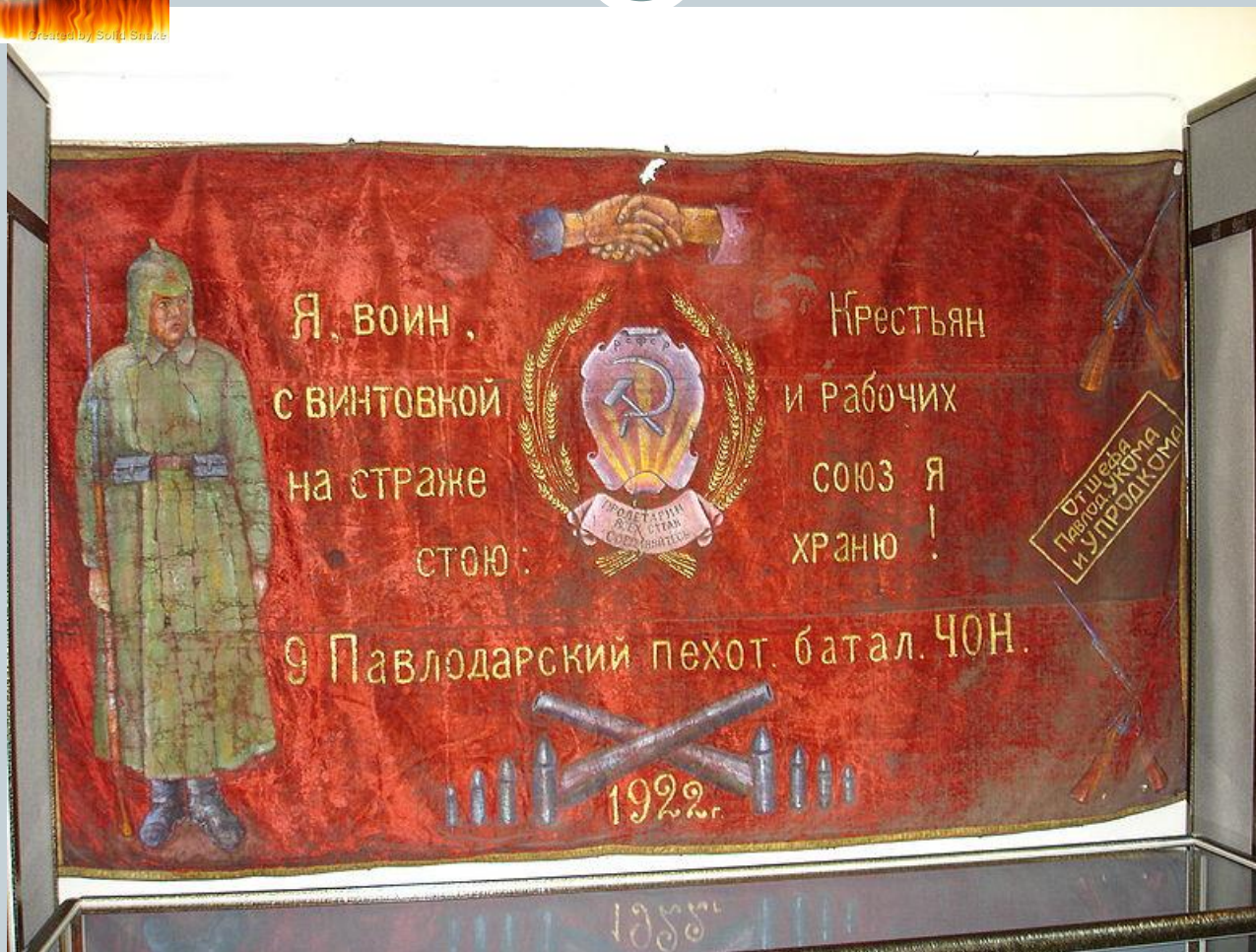
Знамя одного из отрядов ЧОНа