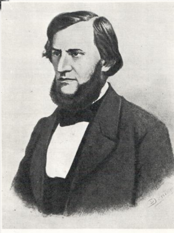
К. Д. Ушинский 1823-1871 гг.

«Наше Отечество, наша Родина матушка Россия».