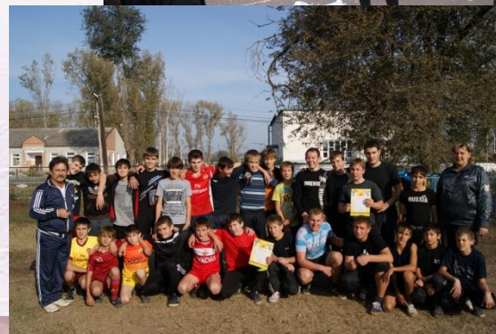
Соревнования по футболу между командами школ