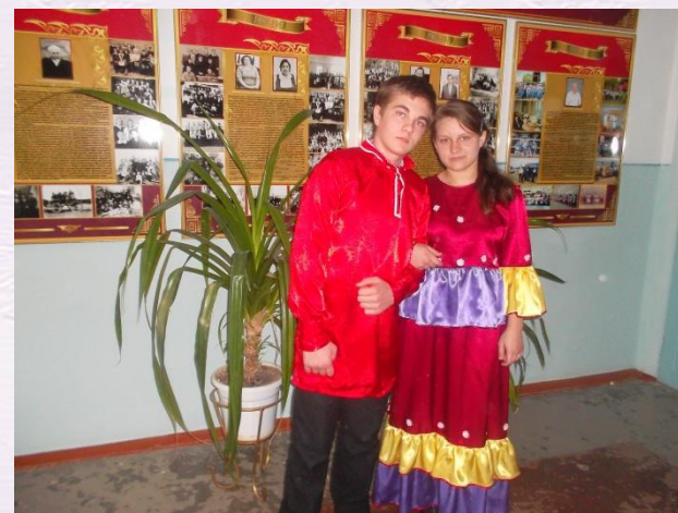
Участие в конференции