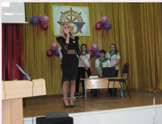
Конкурс «Штурман детства»