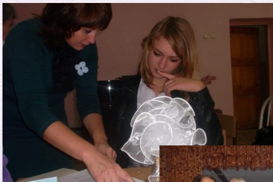
За минуту до начала...