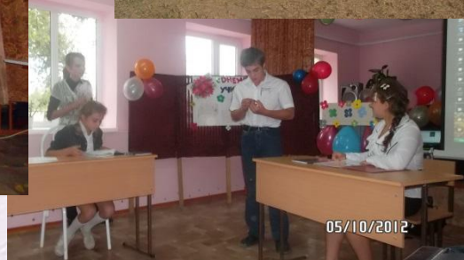
День Учителя. Сценка «На уроке»