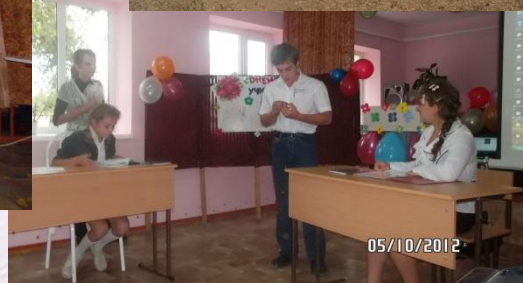
День Учителя. Сценка «На уроке»