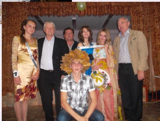
Мисс осень - 2013