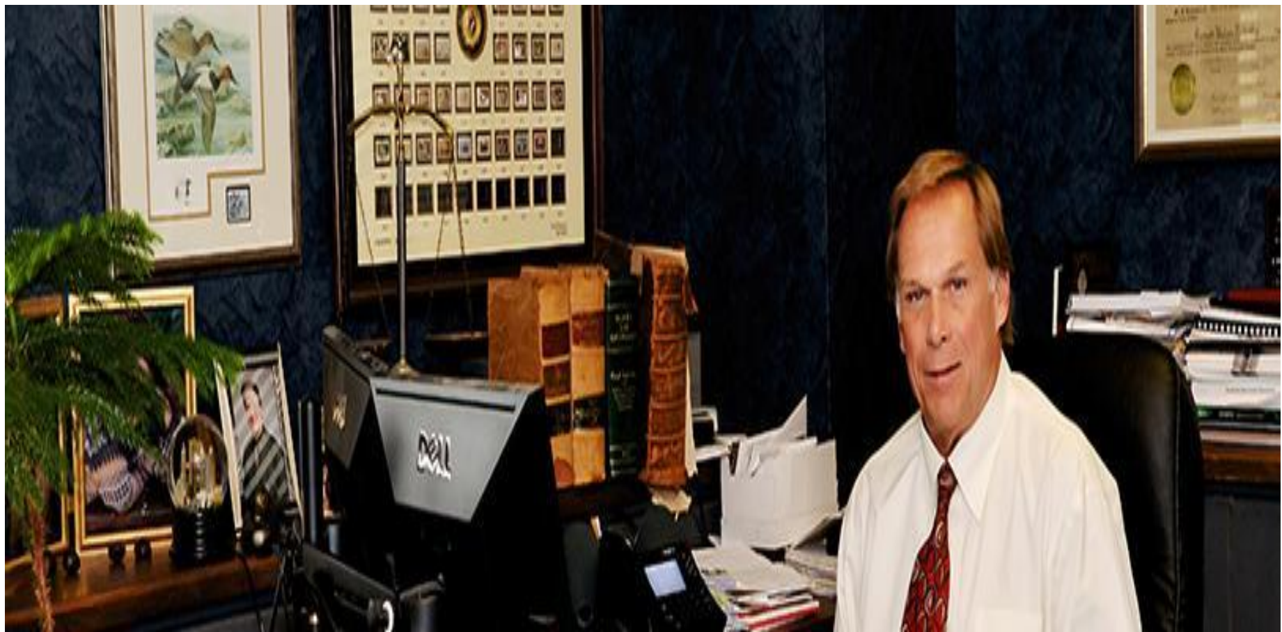
Британский психотерапевт К.Уоллес