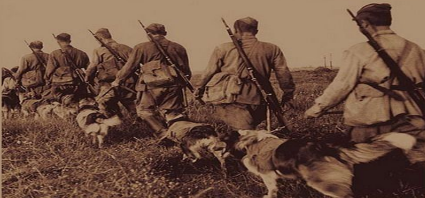
фото 1942 года . Фронтовые собаки -Бойцы со своими проводниками.