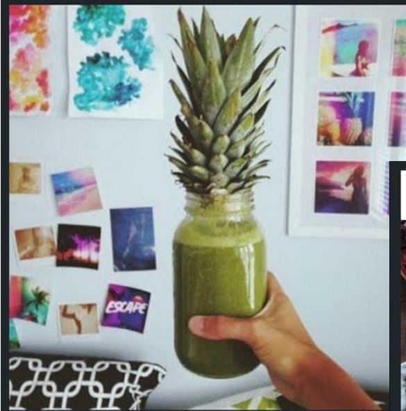
FEATURE FRIDAY! @katgaskin of Salty Pineapple shared this rawesome photo of her Pineapple Upside Down Cake green smoothie! We love seeing photos from all of our challengers :-). She said... "Pineapple Upside Down Cake green smoothie from Simple Green Smoothies. Beheading a pineapple always makes me sad." What rawesome photos are you taking? #GreenSmoothieChallenge #SimpleGreenSmoothies #Healthy #Yum #Pineapple