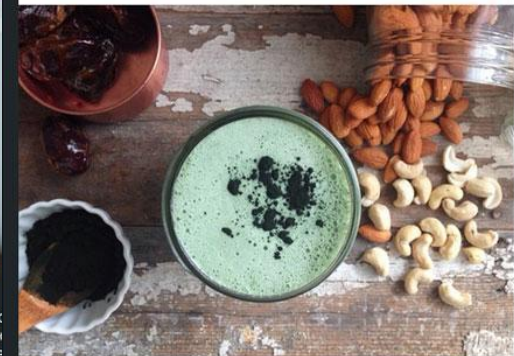
First- thank you all for your kind comments on my underweight nutrition post. I'm so glad it helped so many of you! A couple weeks ago I shared with you all my Banana Milk recipe, today on NS I shared something that may turn your snack time upside down- introducing Blue-green Spirulina Milk, the truest plant-based protein "shake". Cheers! (recipe on NS) BLOG

NutritionStripped.com COACHING // nutrition coaching services available via Skype/telephone US & international