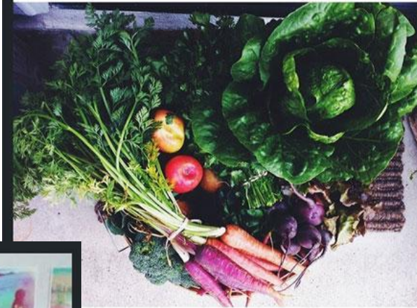
abundant CSA. All is right.

Фестиваль Умного и Здорового образа жизни