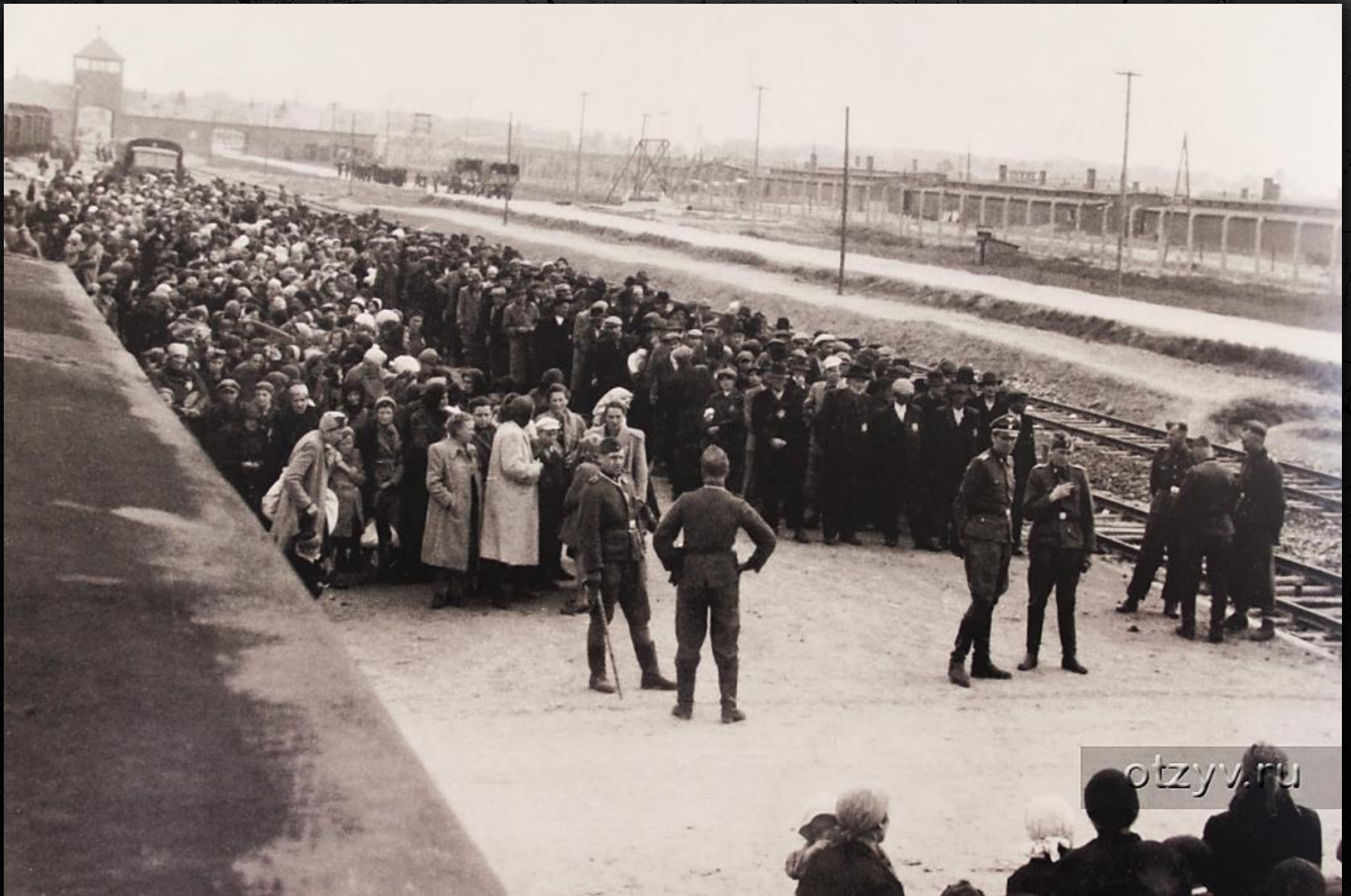
Освенцим. Платформа для сортировки вновь прибывших узников.