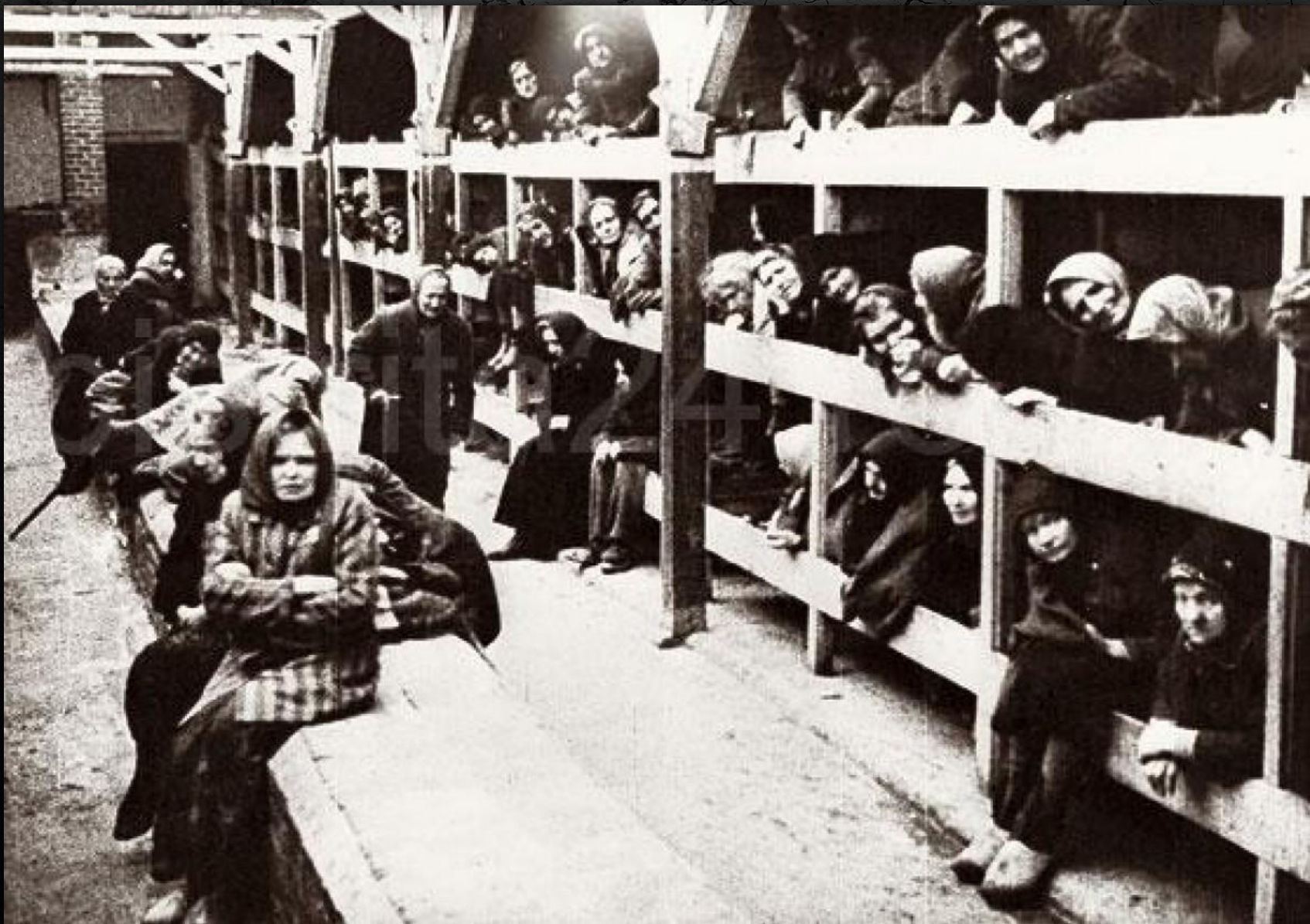
Освенцим: концлагерь Аушвиц