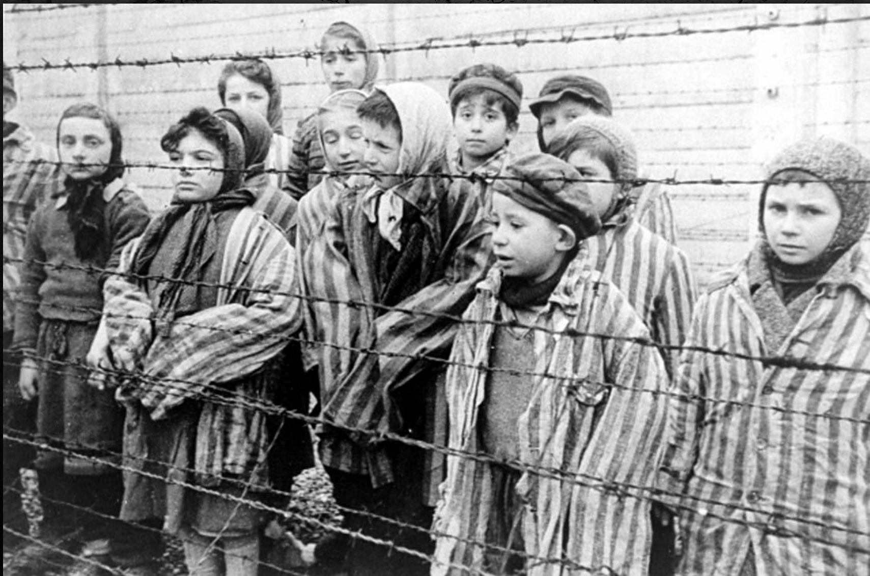
Узники лагеря : мирное население оккупированных территорий, старики и дети.