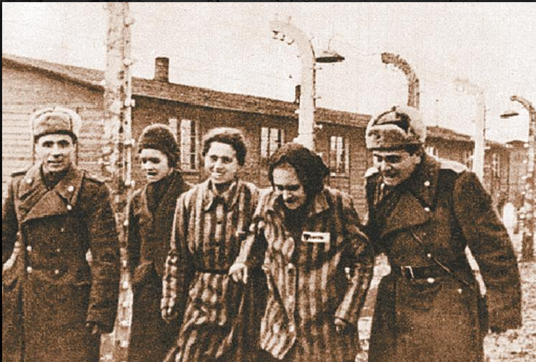
Их освободила 100 Львовская кавалерийская дивизия