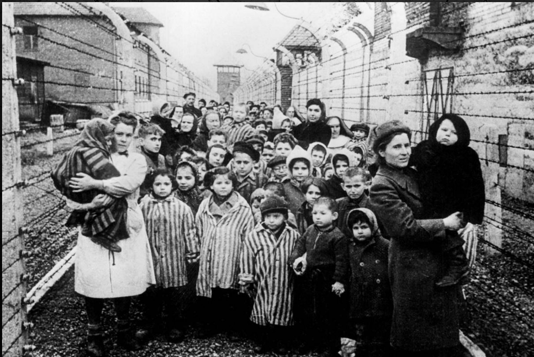
Спасенные дети - узники Освенцима