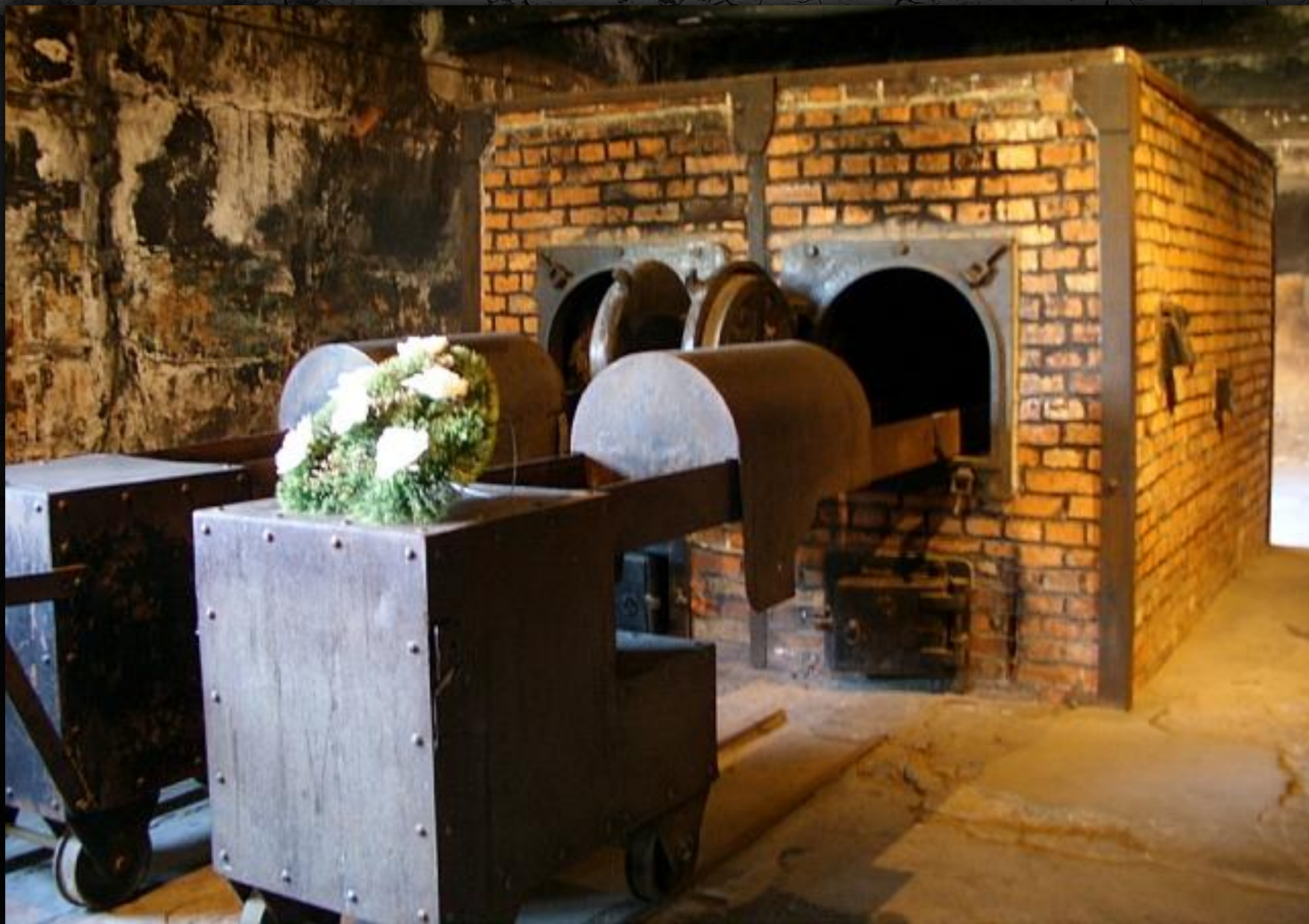
Освенцим: газовая камера и крематорий