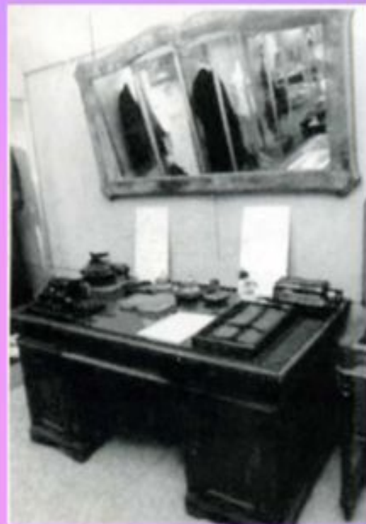
Московский музей меценатов