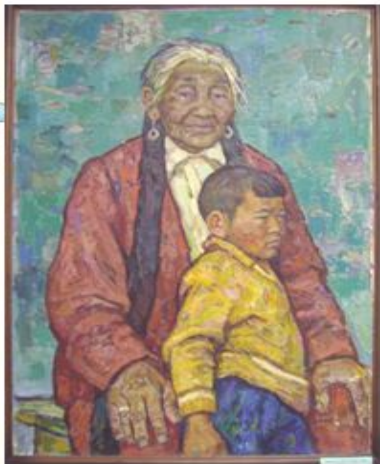
«Бабушка и внук» 1967г.