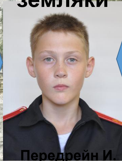
Передрейн И. В. 2 рота