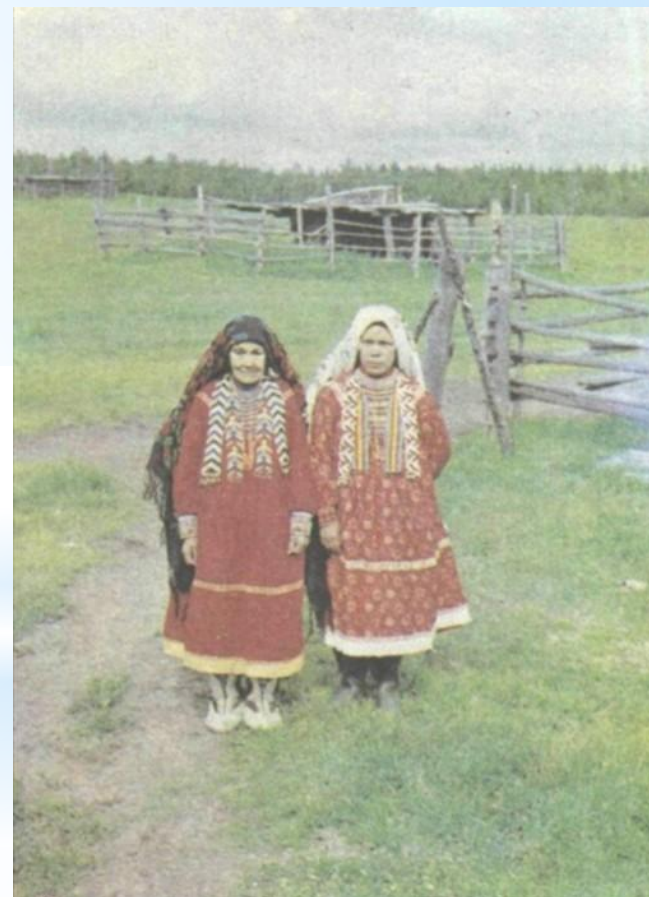
6 Вогулы - манси