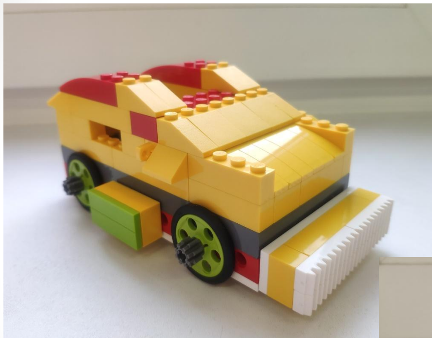
Вид сбоку (правая, левая сторона)