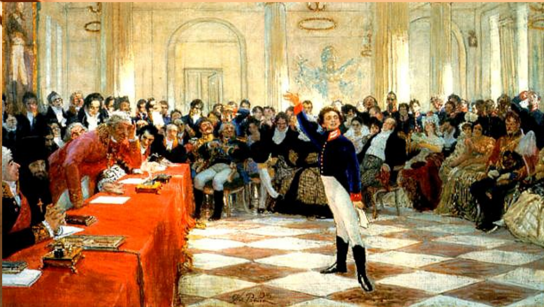
А.С.Пушкин на акте в Лицее 8 января 1815 года