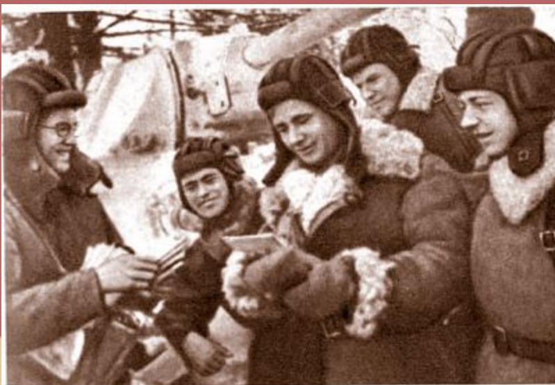
Когда приходит почта полевая...