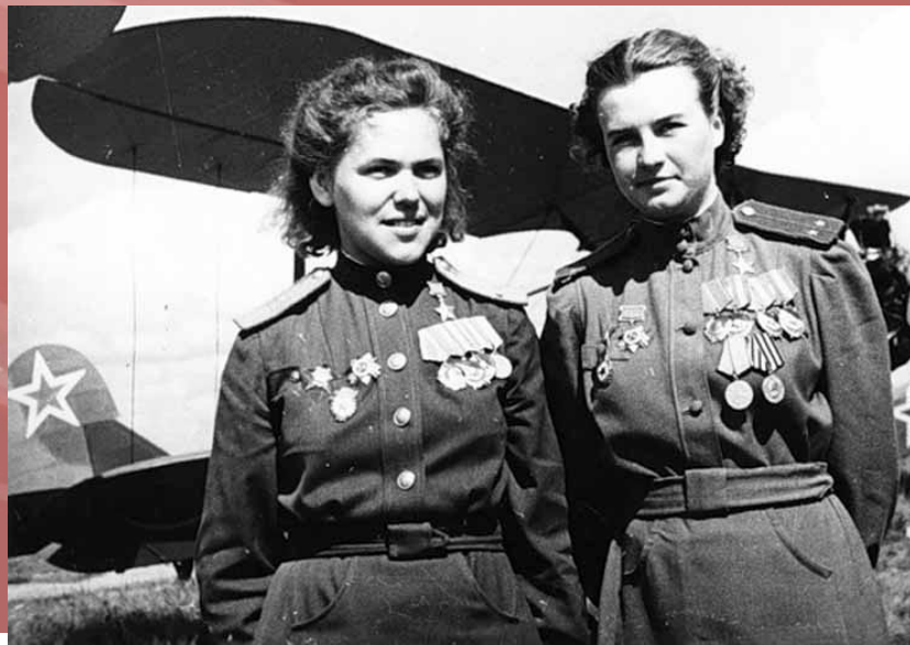
орден Отечественной войны