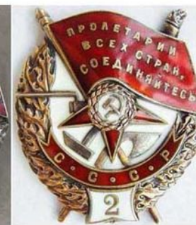
для повторного награждения