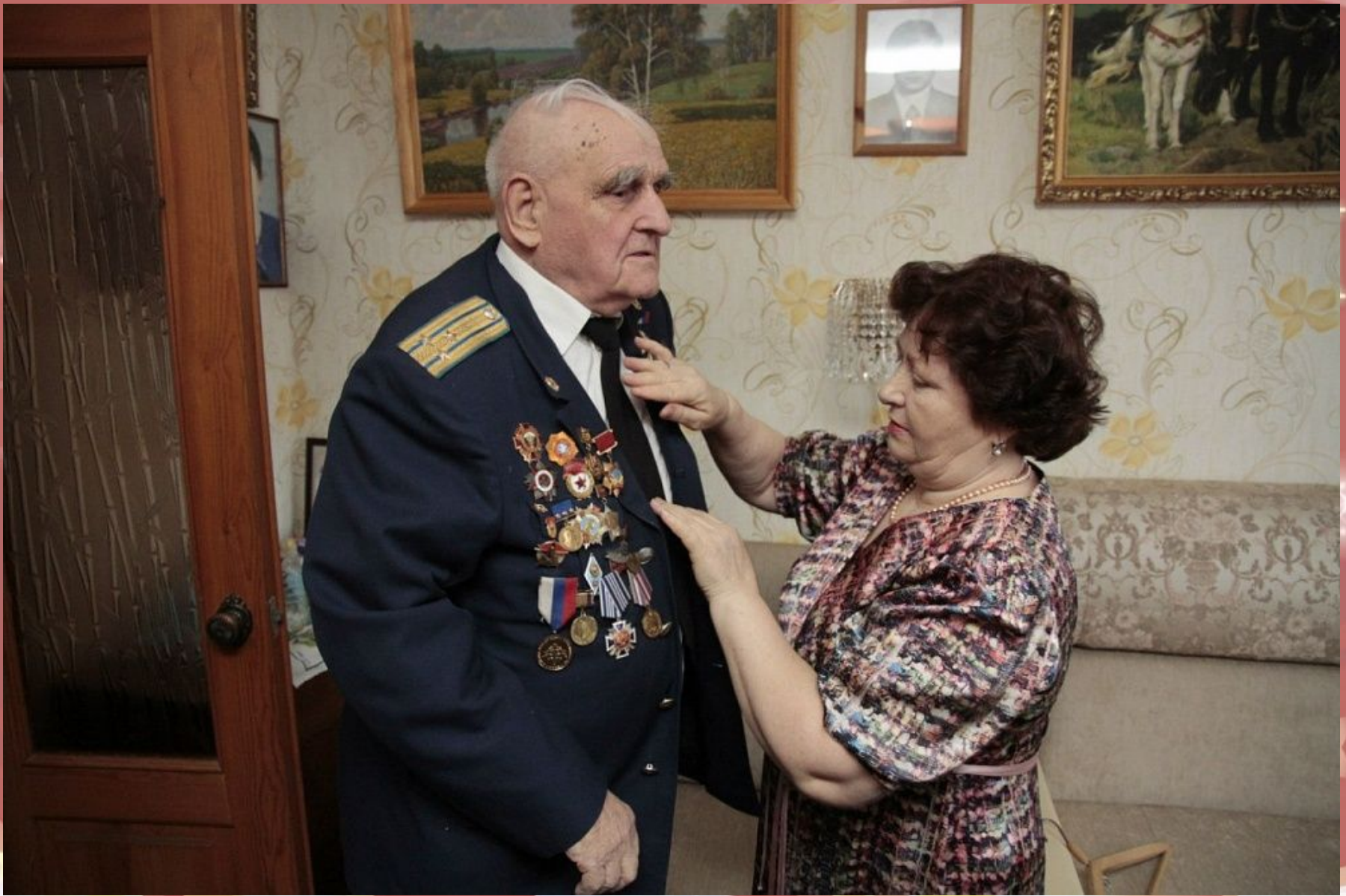
Героя России летчик-истребитель, житель г. Тула - Иван Леонова