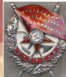
Вариант 30-х гг.