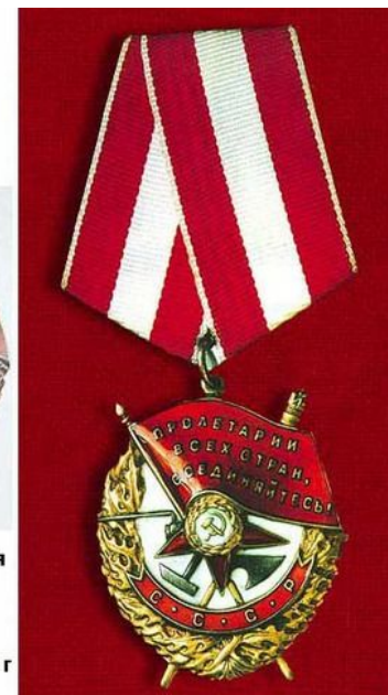
Вариант с лета 1943 г