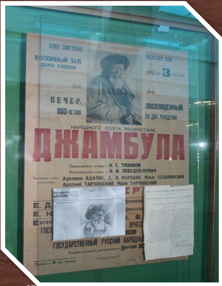
Жамбыл Жабаевтың 100 жылдық мерейтойына шыққан афиша