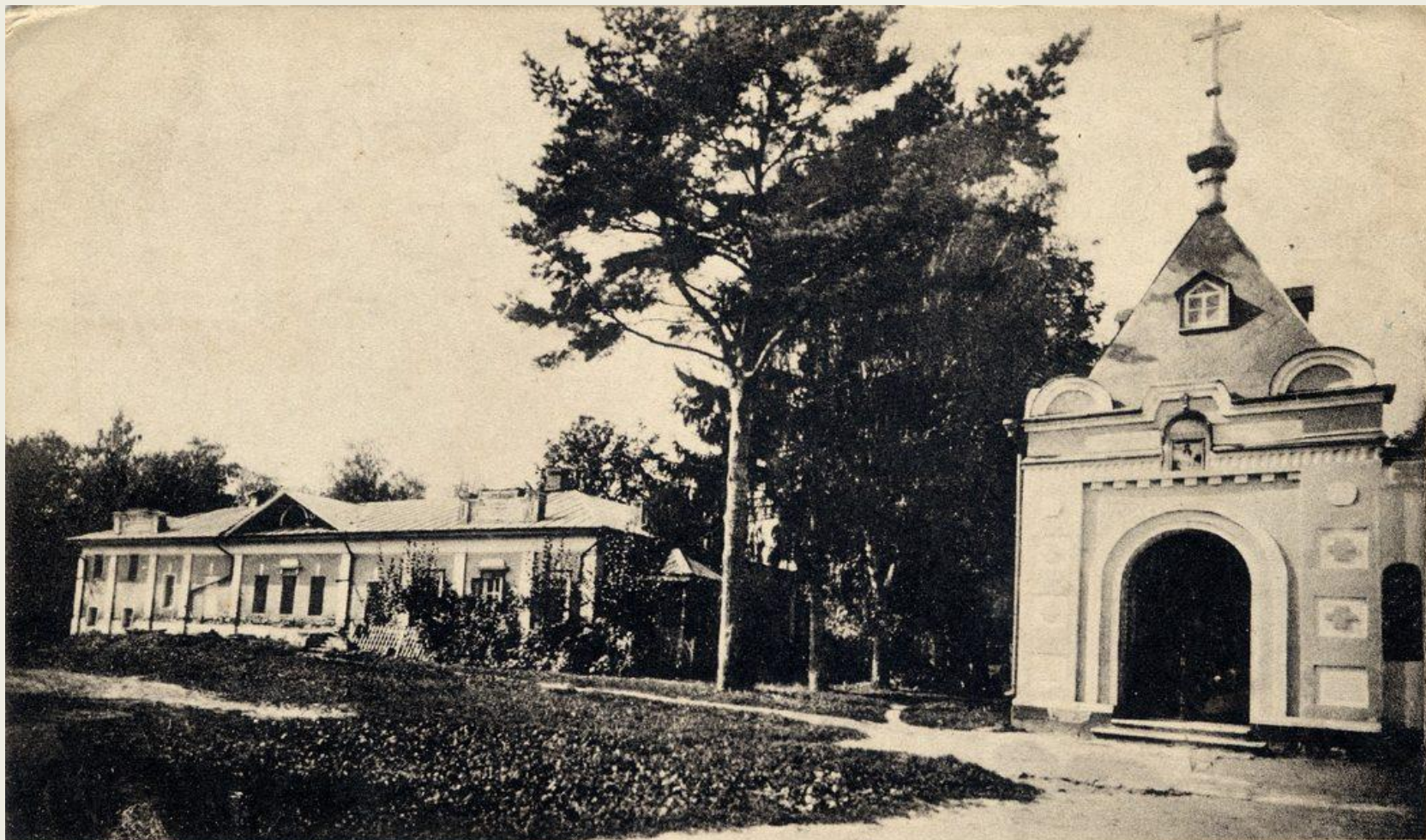
Екатерининская Общежительная Пустынь, Московской губ., Подольскаго уѣзда основана Царемъ Алексѣемъ Михайловичемъ въ 1658 г.