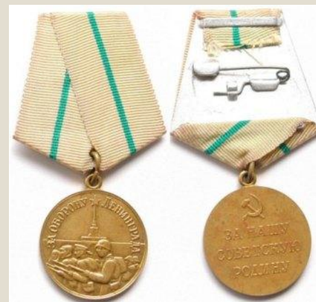
МЕДАЛЬ «ЗА ОБОРОНУ ЛЕНИНГРАДА» Диаметр — 32 мм Материал — латунь Дата учреждения: 22 декабря 1942 года Количество награждений: 1470000