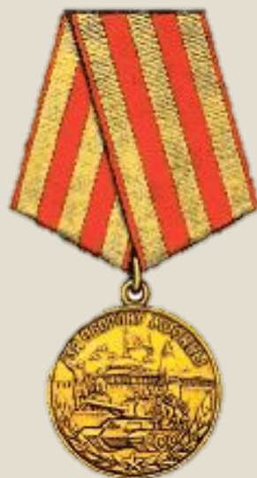
Медаль «За оборону Москвы» Учреждена Указом Президиума ВС СССР 1 мая 1944 года. Всего медалью награждено более миллиона человек, в том числе 20 тысяч детей.