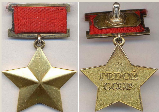
МЕДАЛЬ «ЗОЛОТАЯ ЗВЕЗДА» ГЕРОЯ СОВЕТСКОГО СОЮЗА Количество награждений: 12776