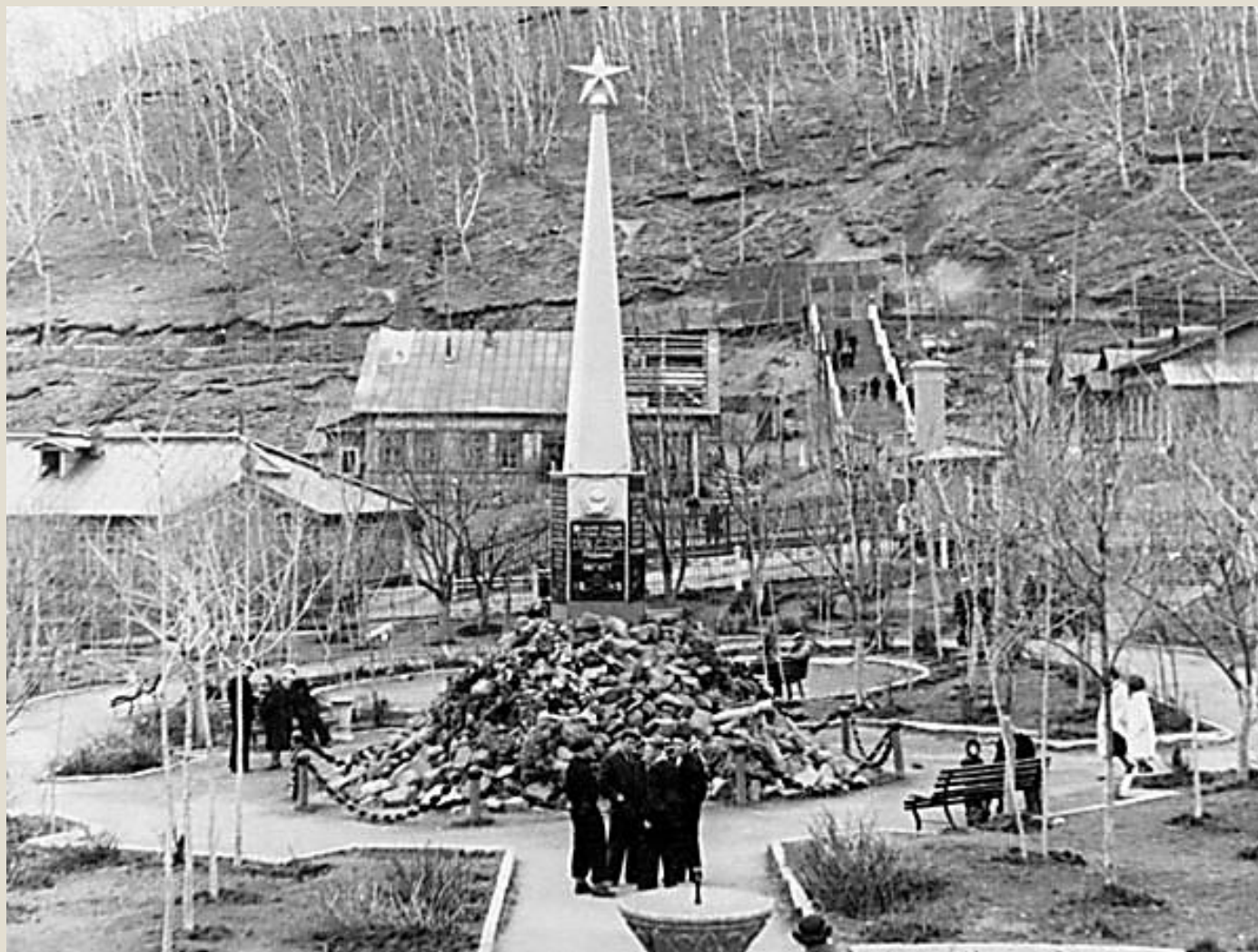
Памятник воинам, погибшим при Курильской десантной операции в августе 1945 года. Памятник установлен в августе 1946 года