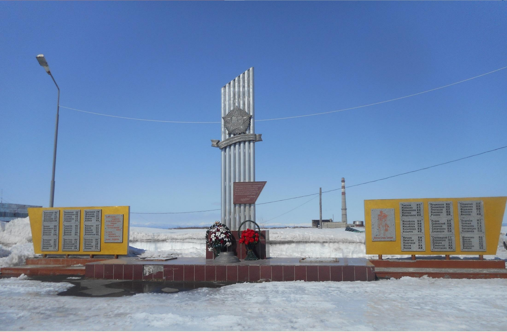
Памятник воинам, участникам в Великой Отечественной войне. П. Усть-Камчатск