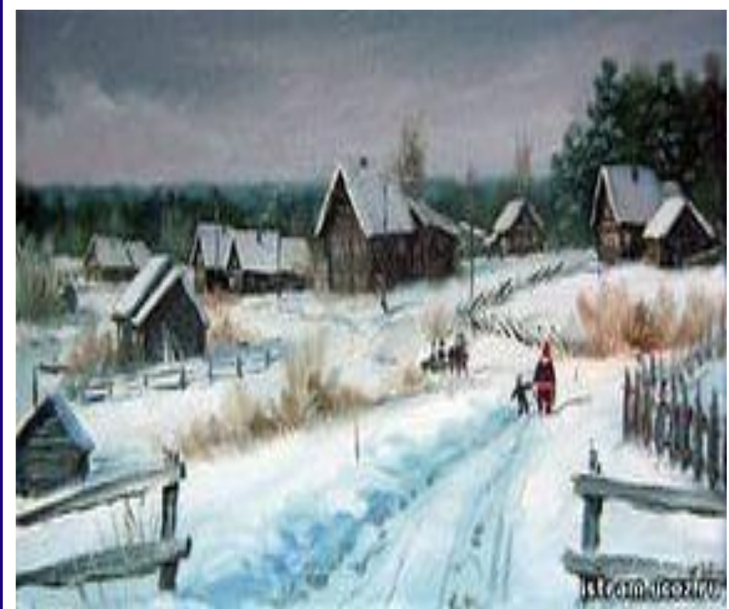
Рисунки из книги Г. Замаратского « Песни полей » (илимские были)