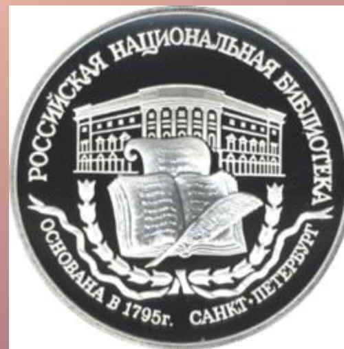
серебряная памятная монета Банка России, 1995 год