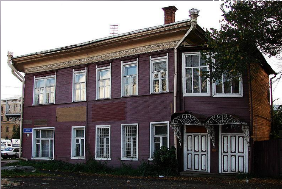
Дом Черноглазова (1905)