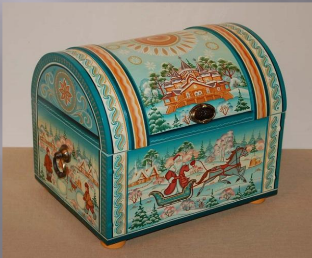
Роспись по дереву