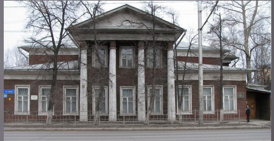
музей Дипломатического корпуса