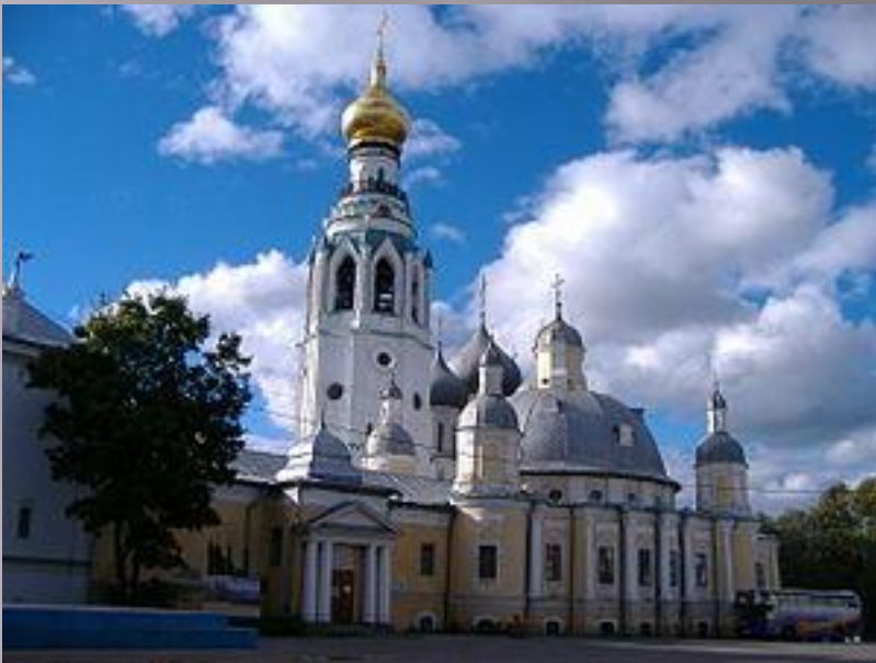
Областная картинная галерея