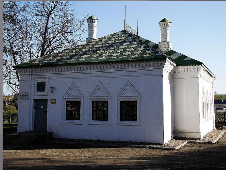
Домик Петра 1