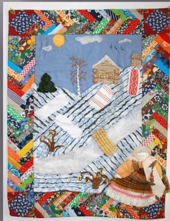
Искусство лоскутного шитья