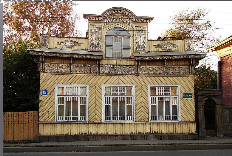
Дом Зернова (1913)