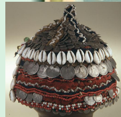
Такья – девичья шапочка