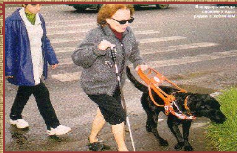
Поводырь всегда спокойно идет рядом с хозяином

Собак-поводырей, или проводников, в нашей стране стали профессионально готовить после Великой отечественной войны. В результате ранений, полученных на фронте, появилось много молодых людей, потерявших зрение. Их трудоустройство и возвращение к обычной жизни стало проблемой. Для их реабилитации были открыты учебно-производственные предприятия, специальные школы-интернаты и училища. Но наряду с новыми профессиями инвалидам нужно было обрести свободу передвижения, освободиться от постоянной зависимости от помощи других людей. Дать возможность ходить свободно могли только специально выдрессированные собаки-проводники. Первые собаки-проводники были подготовлены в 1947 году в Центральной школе служебного собаководства. В Центральной республиканской школе проводников для слепых. В этой школе работали специалисты-кинологи. Это были офицеры, прошедшие войну и имевшие уникальный опыт дрессировки использования