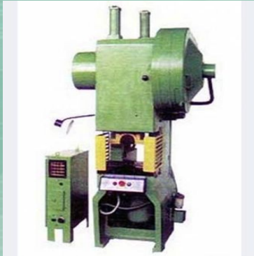
Пресс однокривошипный, холодноштамповочный

Деятельность каждого наладчика специфична, и, зависит от того холодноштамповочного оборудования, на котором он работает