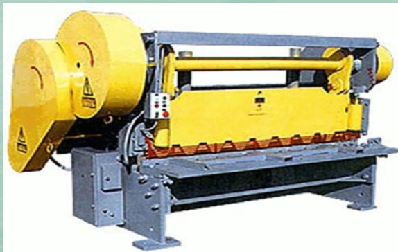
Холодноштамповочный четырехпозиционный автомат для получения крепежных изделий

и другие эксцентровые, фрикционные, кривошипные прессы и автоматы