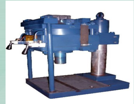
Пресс холодноштамповочный для вырубки, гибки, пробивки