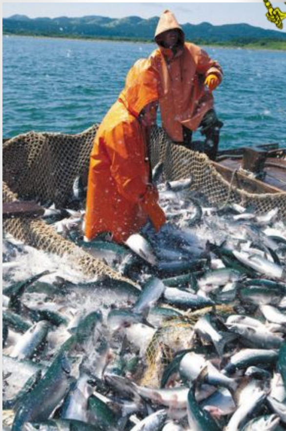
Один рыбак с рождения,