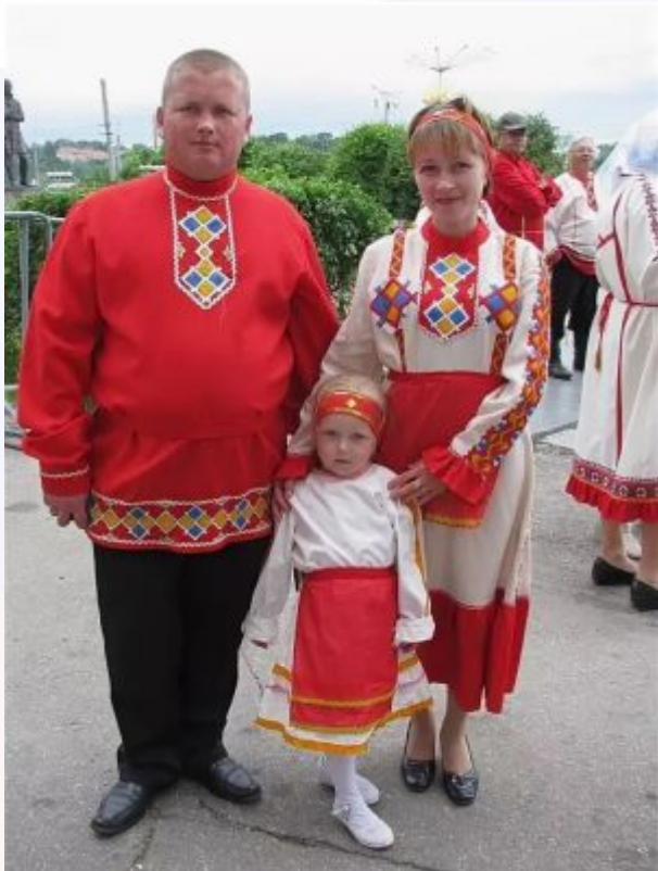
Чувашские национальные костюмы (мужской и женский)

Следующий народ России, является коренным в Чувашской республике, численностью около 2 миллионов человек – башкиры.