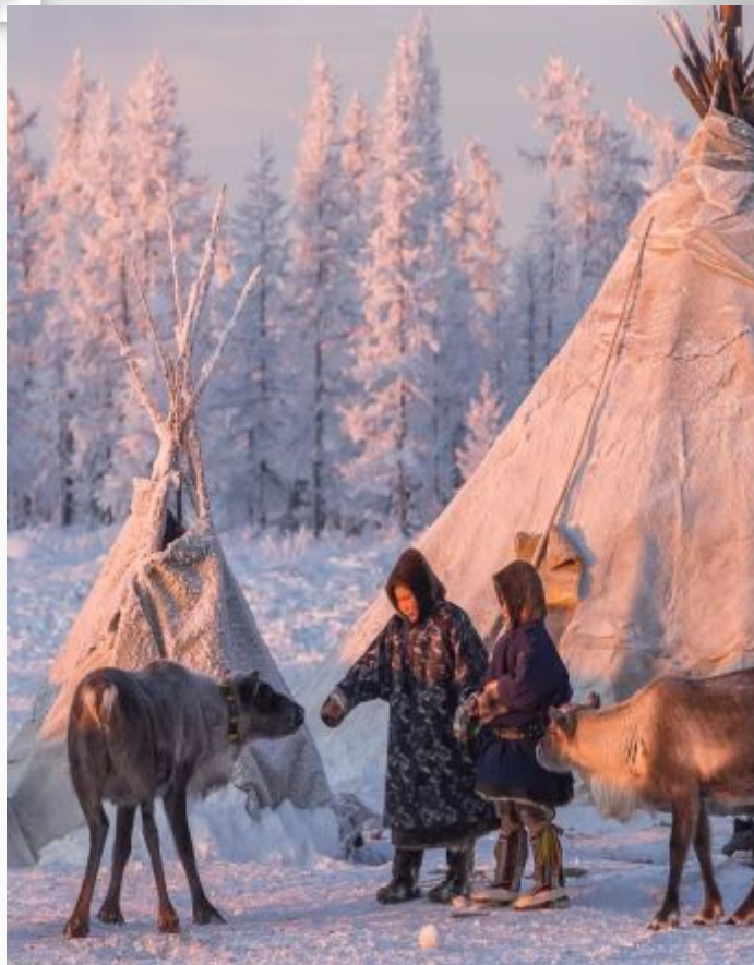
Одним тайга по нраву,