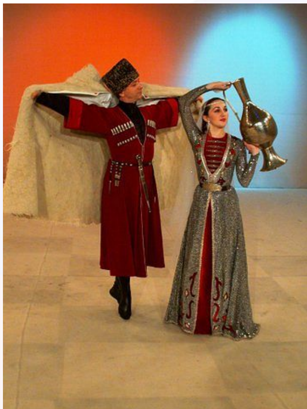
Чеченские национальные костюмы (мужской и женский)

Значение цветов в национальных костюмах: