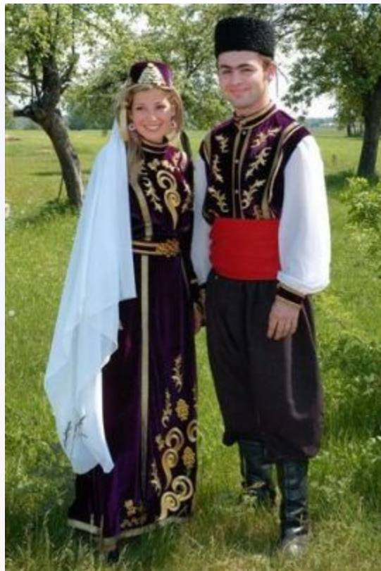
Татарские национальные костюмы (мужской и женский)

Татарские символы зелёный, фиолетовый, жёлтый, красный