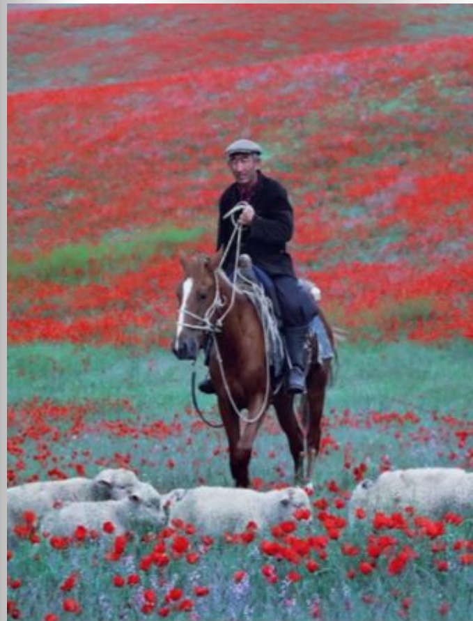
Другим степной простор.