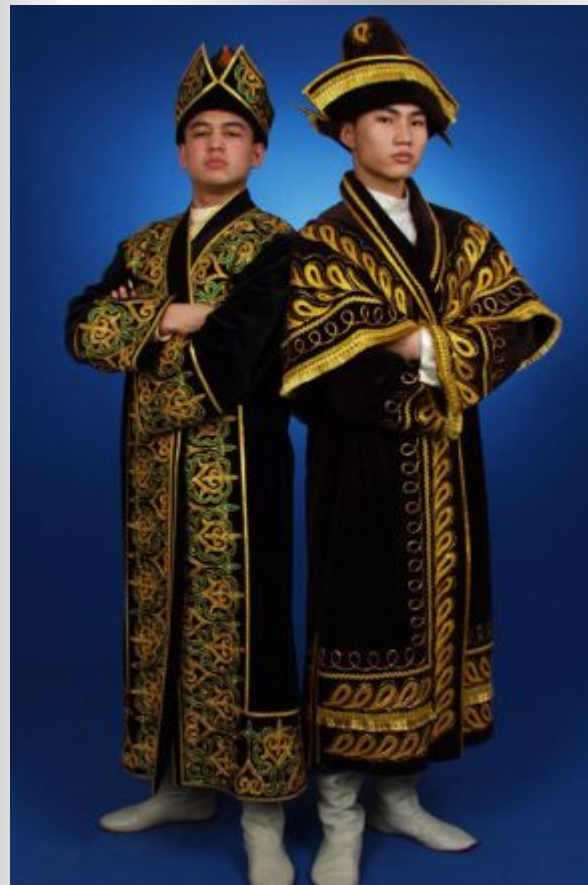
Другой надел халат.