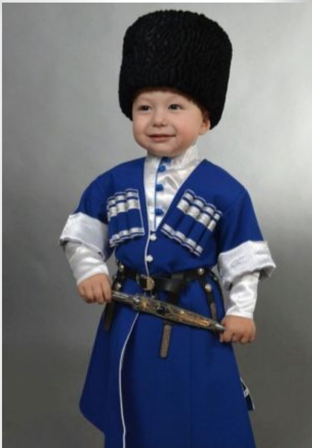
Один черкеску НОСИТ,