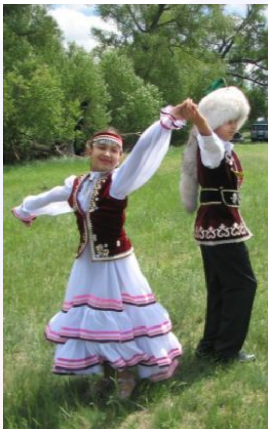
Башкирские национальные костюмы (мужской и женский)