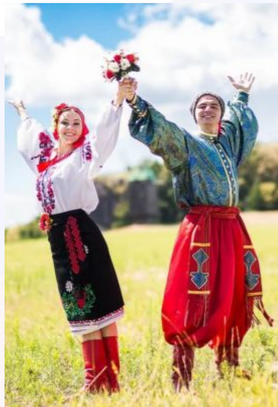
Украинские национальные костюмы (мужской и женский)

На третьем месте в России по численности населения занимает украинский народ, около 4 миллионов человек.