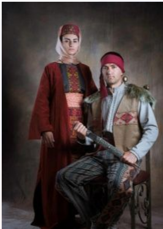
Армянские национальные костюмы (мужской и женский)

На седьмом месте по численности населения в России, занимают армяне, численностью чуть более 1 миллиона человек.