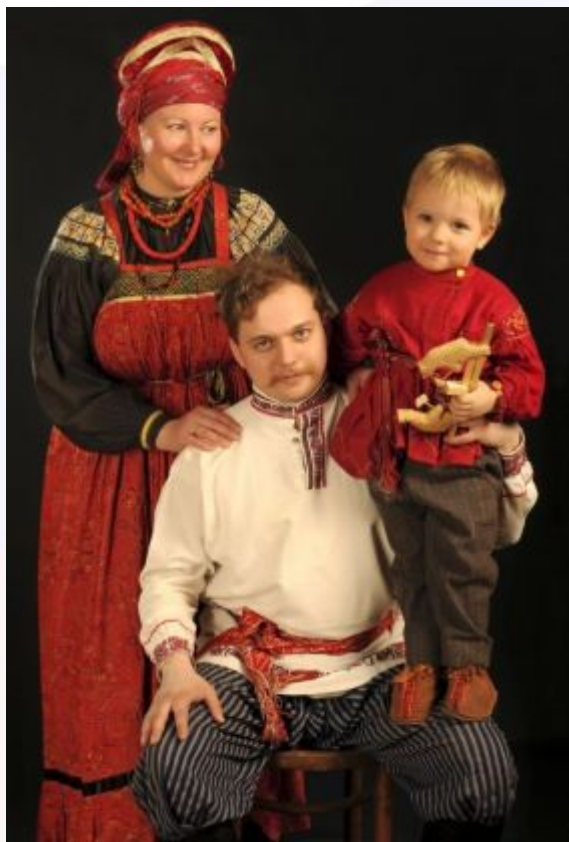
Русские национальные костюмы