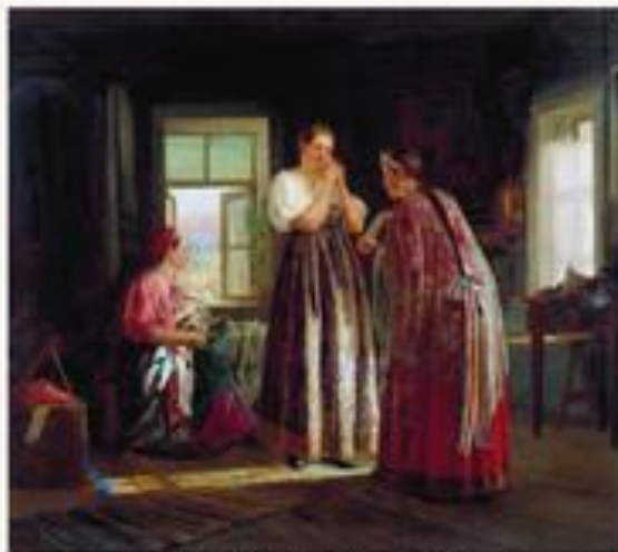
Сборы на гулянье. 1869