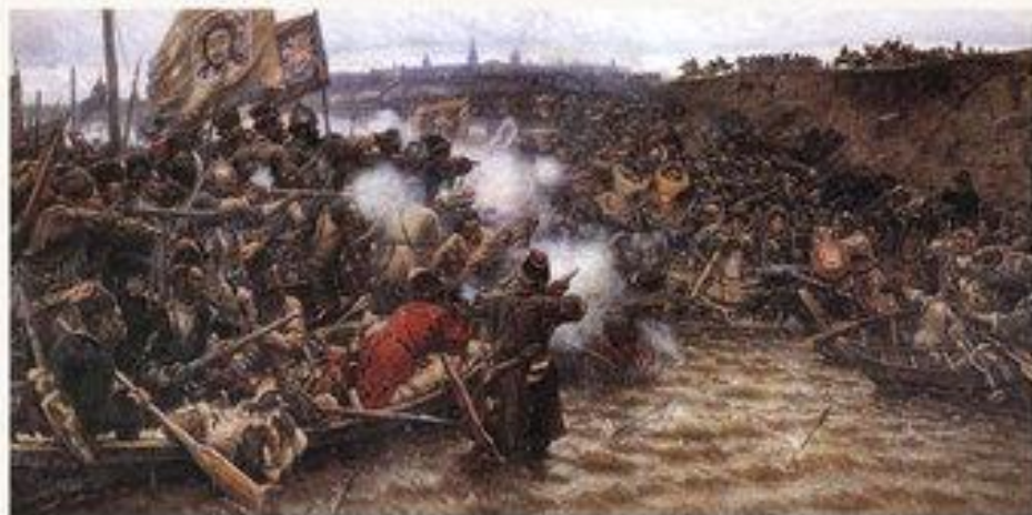
Покорение Сибири Ермаком, 1895