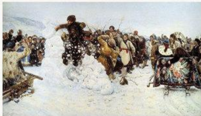
Взятие снежного городка, 1891