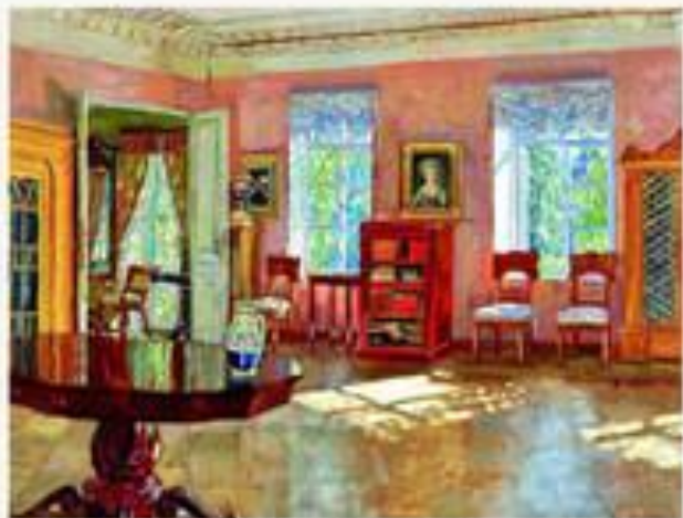
«Интерьер библиотеки помещичьего дома» 1910-е.