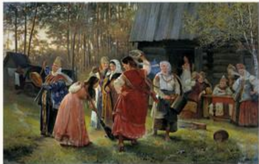
«Девичник» 1889 г.