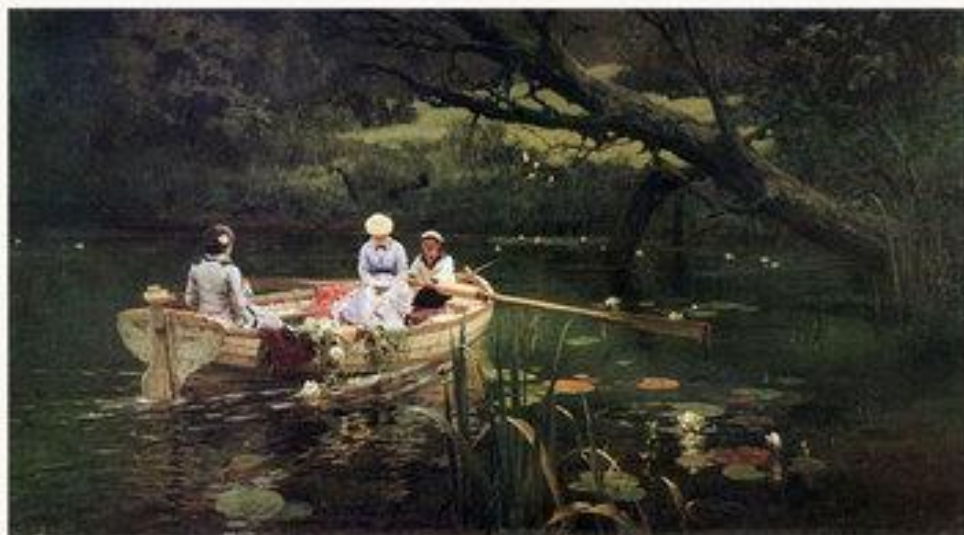
На лодке. Абрамцево. 1880.