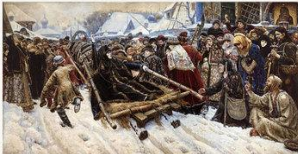
Боярыня Морозова. 1887