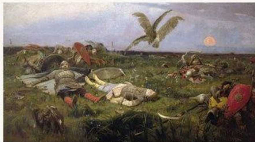
После побоища Игоря Святославича с половцами. 1880.