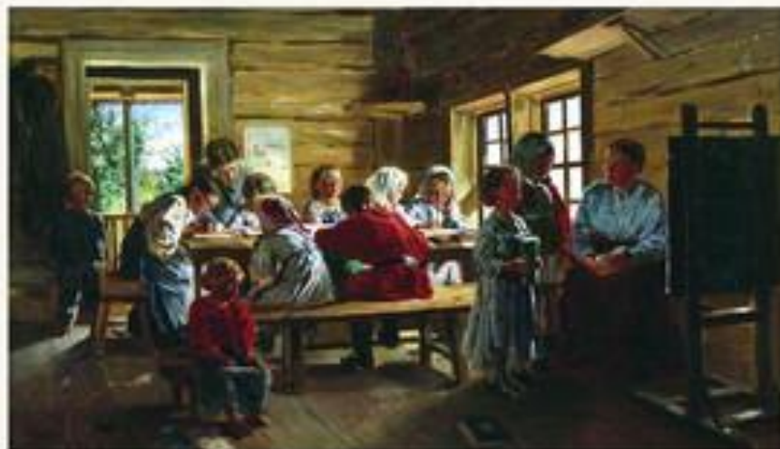
В сельской школе. 1883.