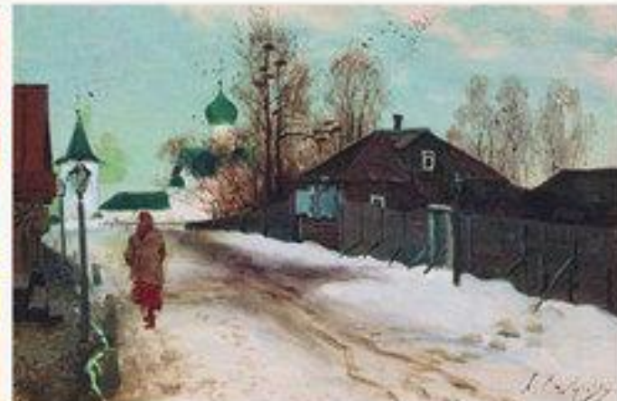
«Михайловская улица в Новгороде» 1899