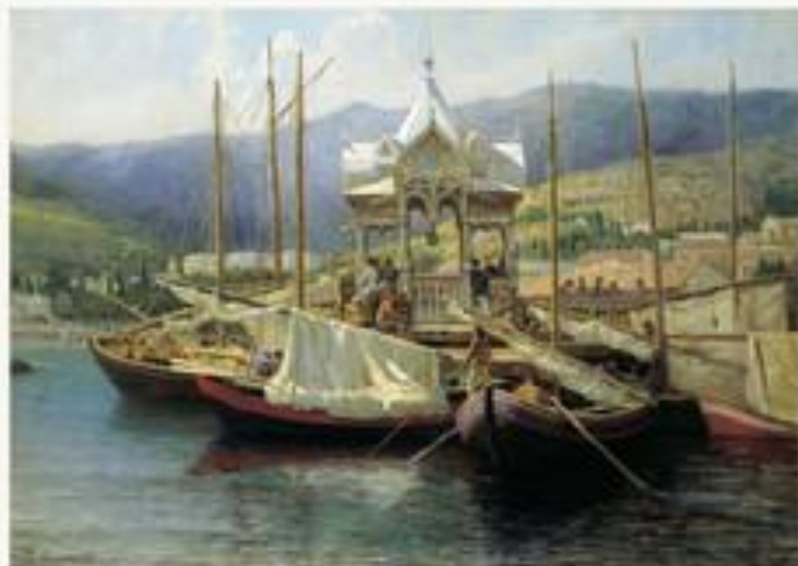
«Пристань в Ялте» 1890 Г.