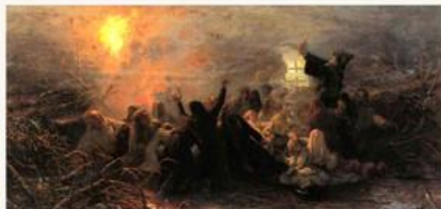
«Самосожигатели» 1884 Г.