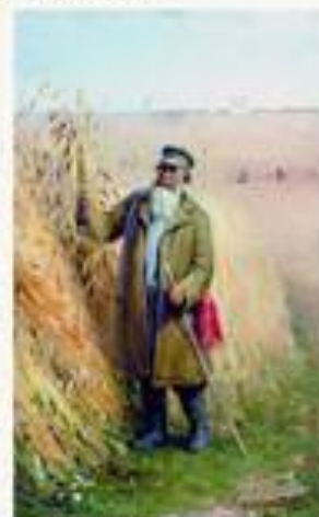
После обеда. 1891