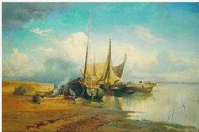
Вид на Волге. Барки, 1870