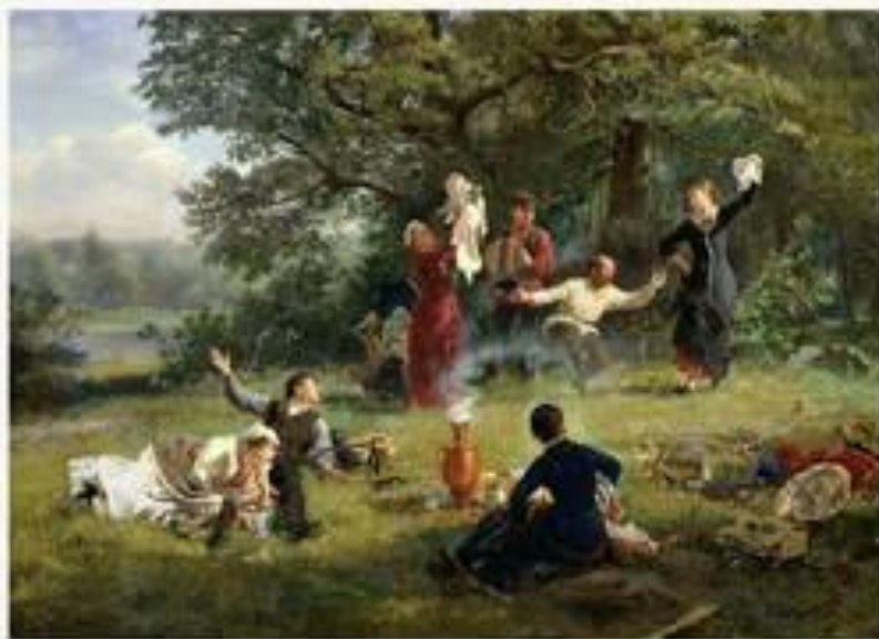
«Воскресный день» 1884 г.