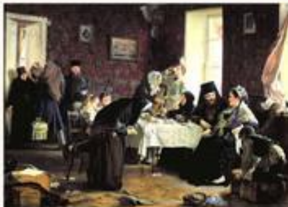
«В монастырской гостинице» 1882 г.