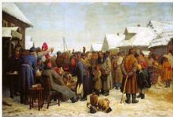
Аукцион за недвижимк. 1880-1881