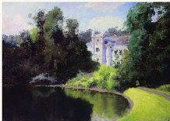
Пруд в парке. Ольшанка. 1877.