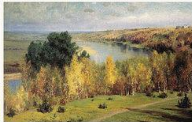
Золотая осень. 1893.