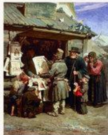
Книжная лавочка. 1876.