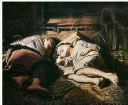
«Спящие дети» 1871