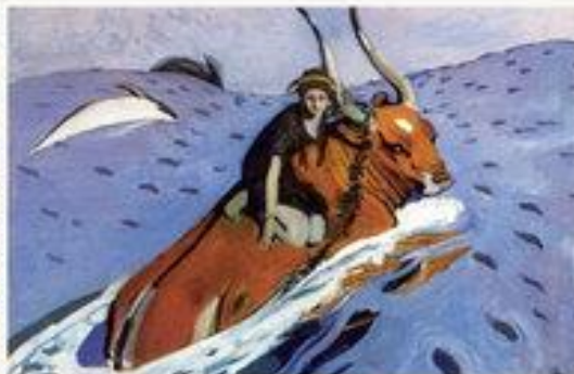
«Похищение Екropy» 1910