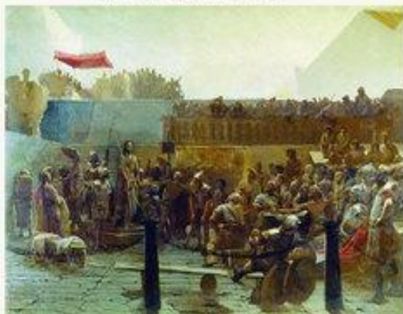
«Хохот (Радуясь, царю иудейский)» 1877-1882 г.