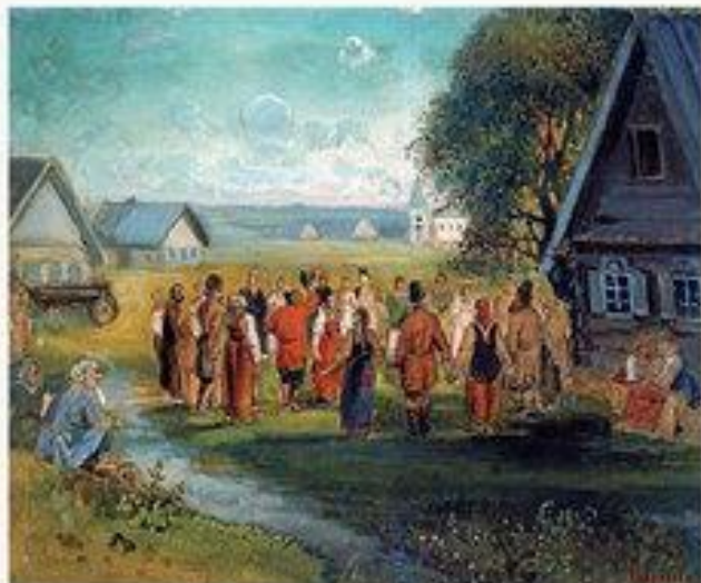
Хоровод в селе, 1873-1874