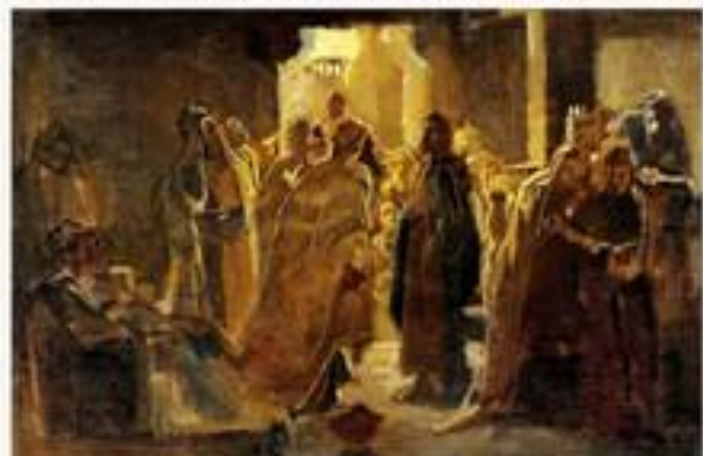
Христос в синагоге. 1868