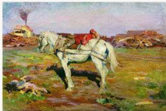
Мальчик в розовой рубашке на белой лошади