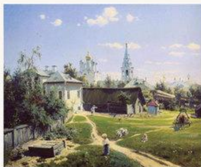
Московский дворик. 1878.