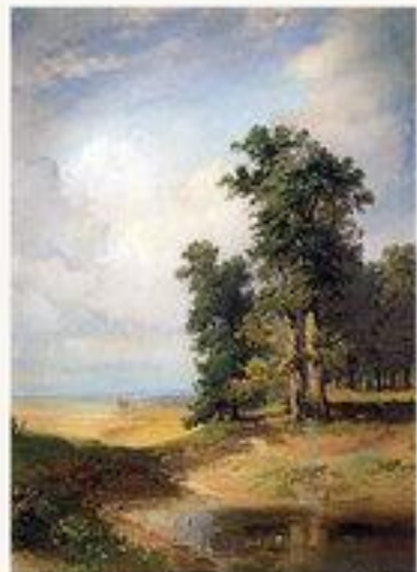
Летний пейзаж с дубами. 1850