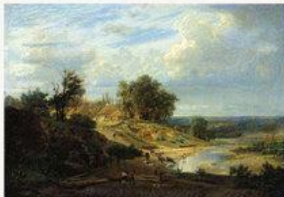
«Вид окрестностей Харькова»