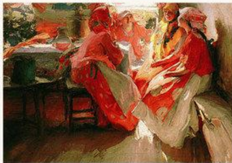
«В гостях» 1915