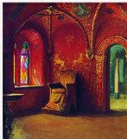
«Красная палата» 1899