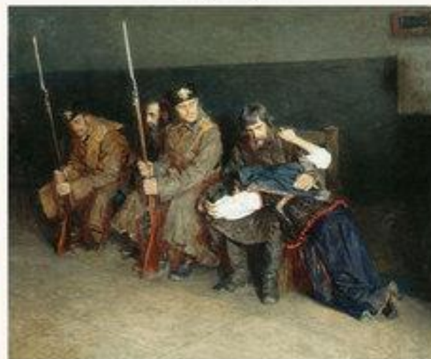
В коридоре окружного суда. 1897