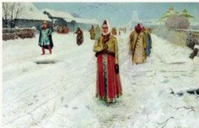
«Воскресный день» 1889