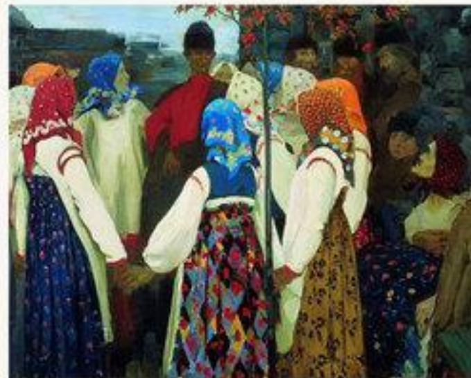
Втерся парень в хоровод, ну старуха охать. 1902