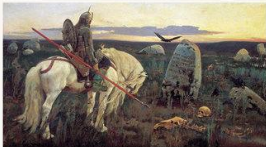
Витязь на распутье. 1882.