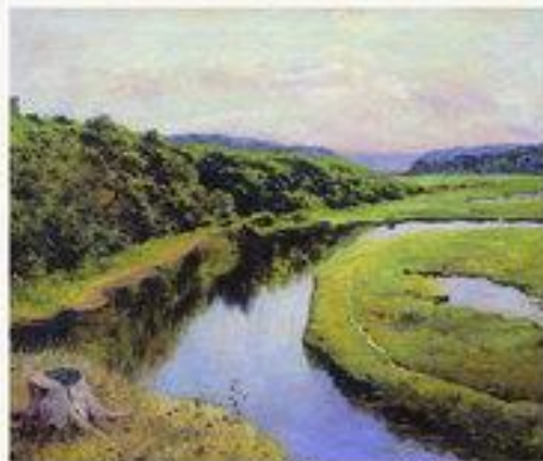
Река Клязьма. Жуковка. 1888.