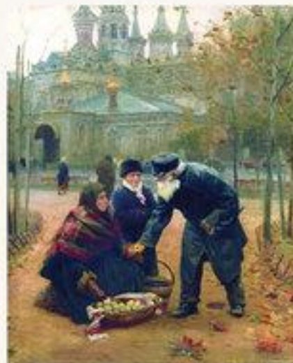
Добрый дедушка 1899