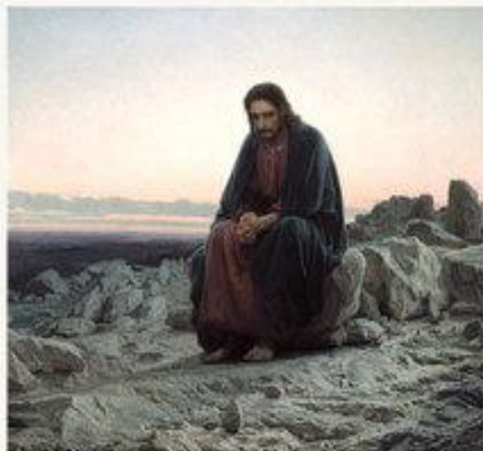
«Христос в пустыне» 1872 г.