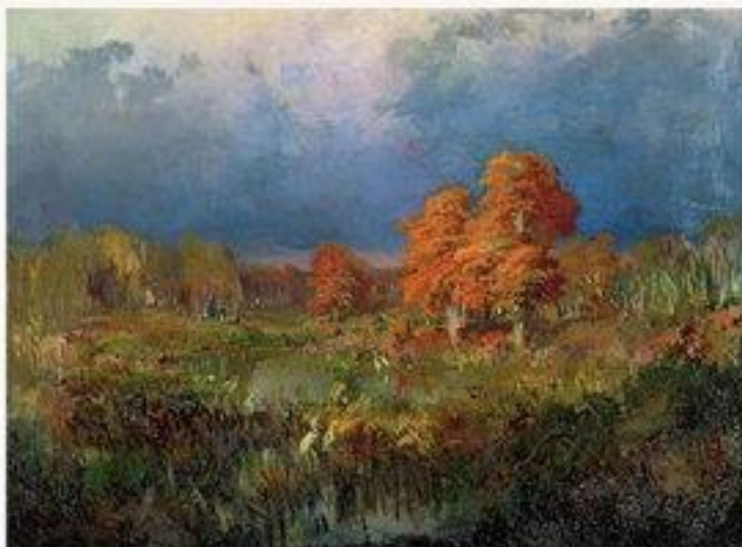
Болото в лесу. Осень, 1871-1873