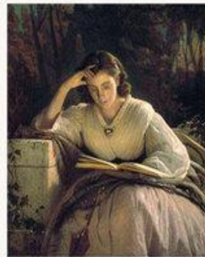
«За чтением» 1866