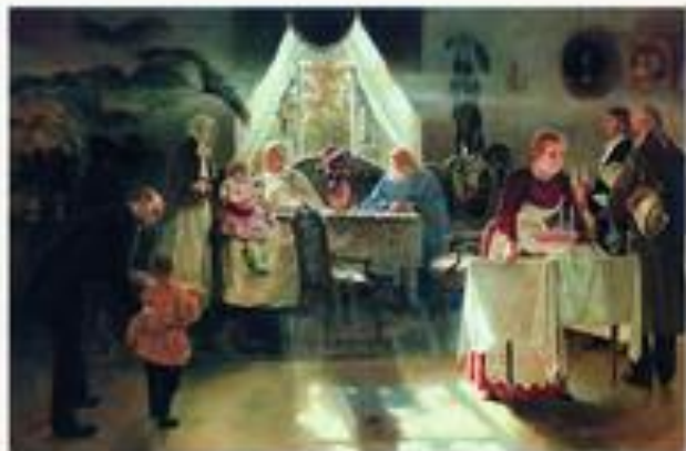
«Бабушкин праздник» 1893 г.