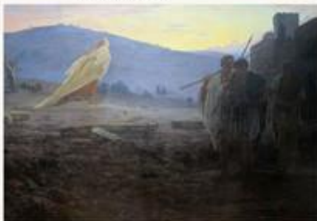
Вестники Воскресения. 1867