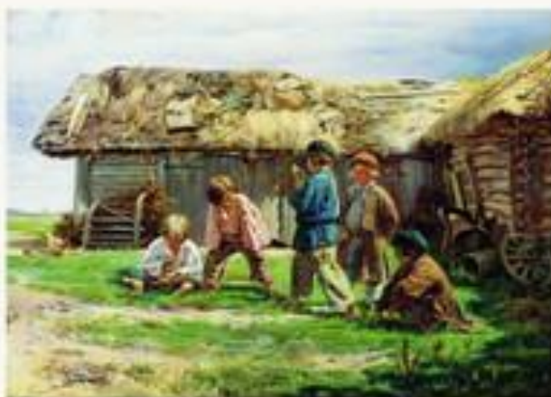
Игра в бабки. 1870.