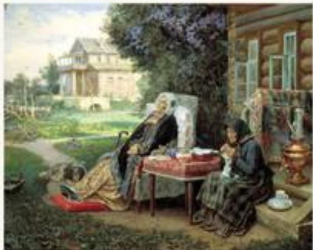
Всё в прошлом. 1889