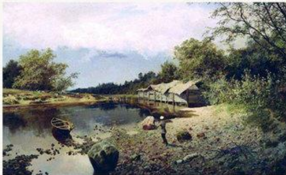
«Забятая мельница» 1891