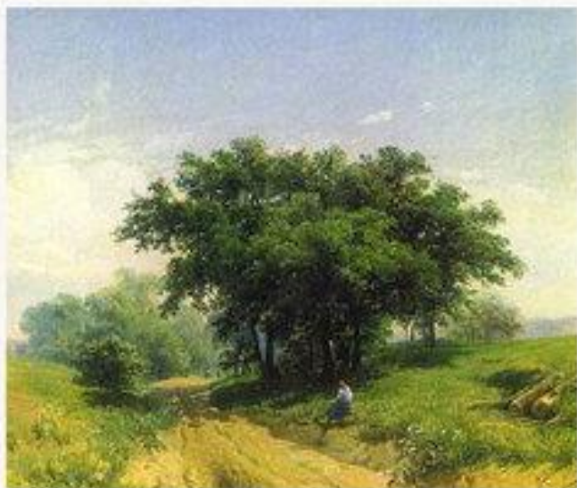
Летний жаркий день