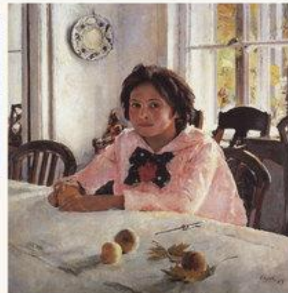
Девочка с персиками. 1887