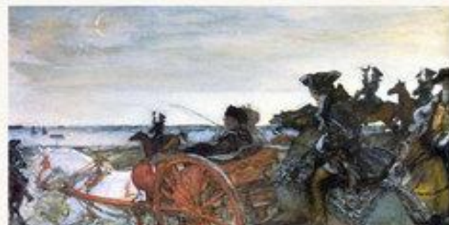
«Выезд Екатерины II на соколиную охоту» 1902