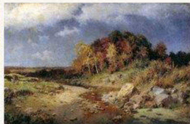
«Осень. Ветреный день» 1903 г