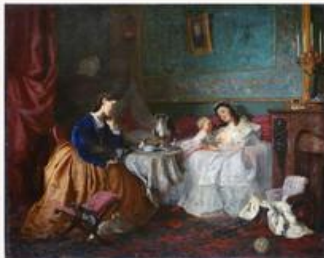
У чужого счастья