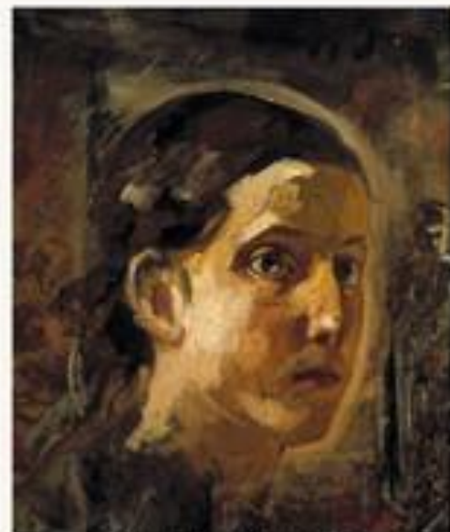
Голова Иоанна Богослова