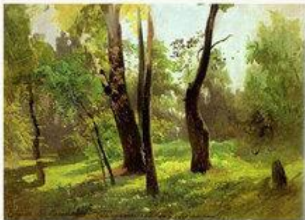
Деревья. Этуд 1869-1870