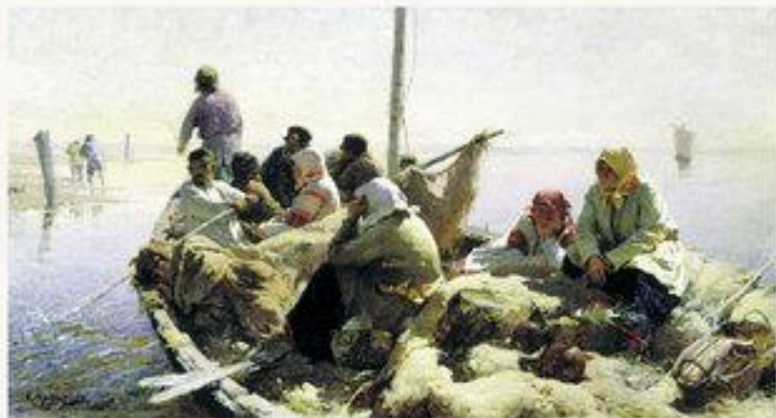
«По реке Оке» 1889 г.