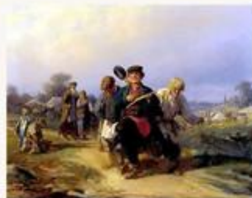
«Возвращение отца семейства с армачком» 1868 г.