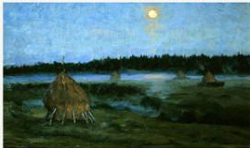
«Восток луны» 1902 г.