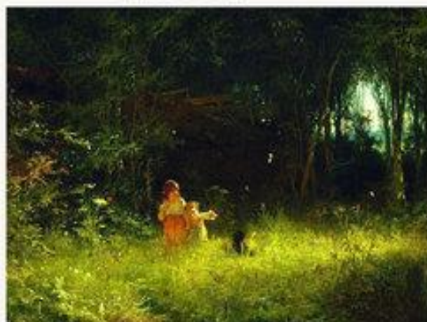
«Дети в лесу» 1887 г.