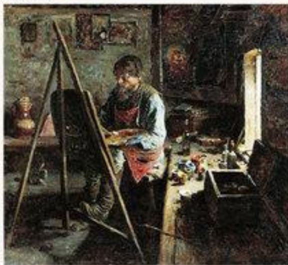
«Деревенский иконописец» 1889 г.