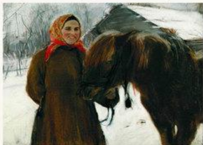
«Баба с лошадыю» 1898