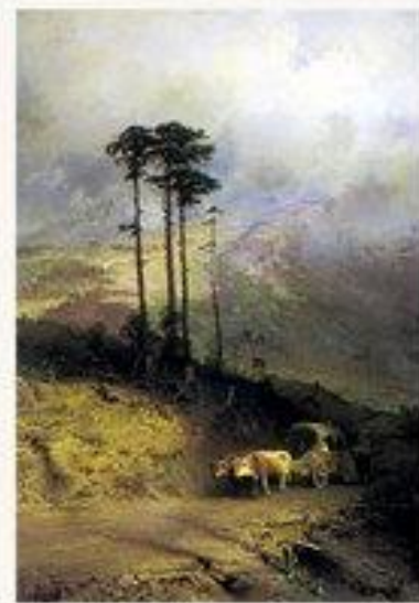
В крымских горах 1873