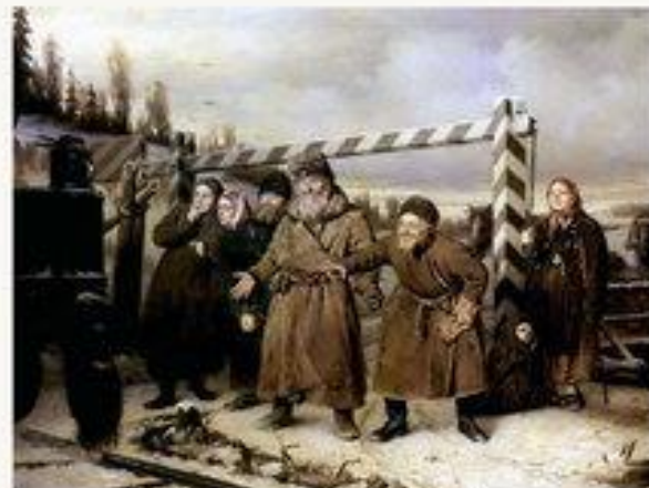
На железной дороге. 1868