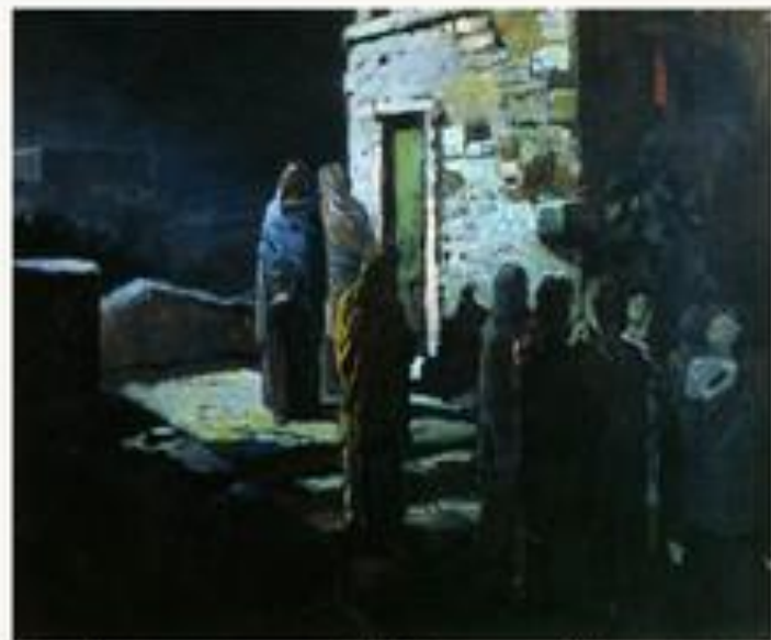
Выход Христа с учениками с Тайной вечери в Гефсиманский сад