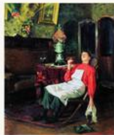
Без хозяина. 1911.