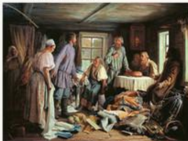
Семейный раздел. 1876