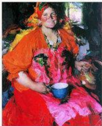
«Девушка с кувшином» 1927