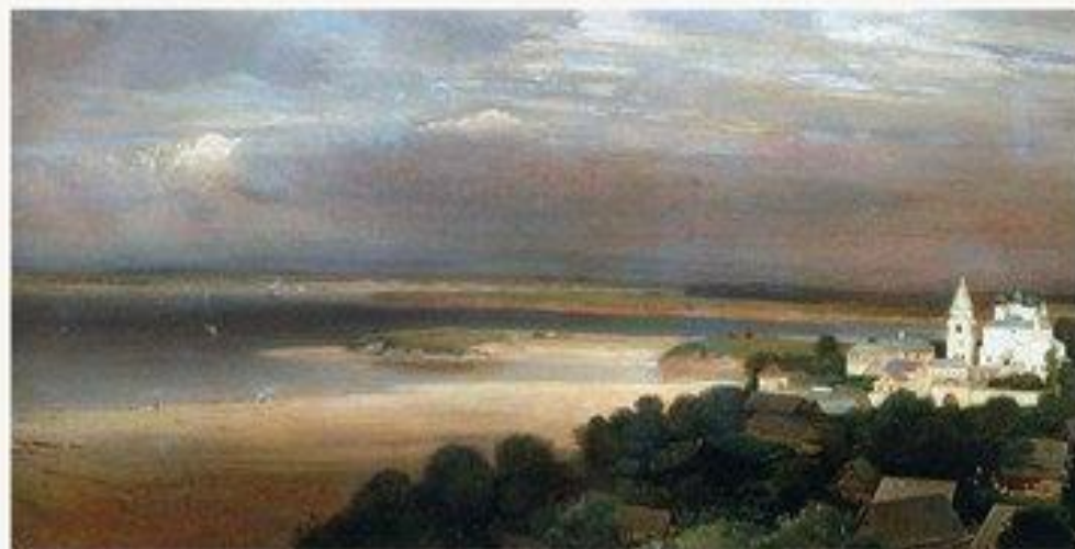
Печерский монастырь под Нижним Новгородом. 1871