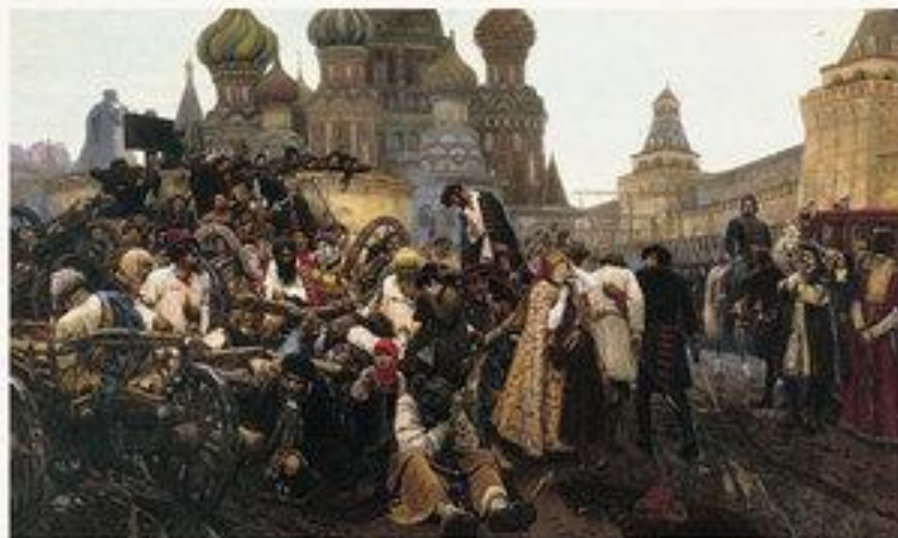
Утро стрелецкой казни. Описание картины. 1881