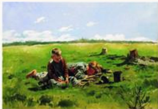
Мальчики в поле.