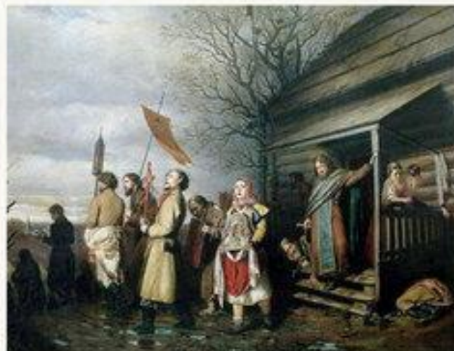
Сельский крестный ход на Пасхе. 1861