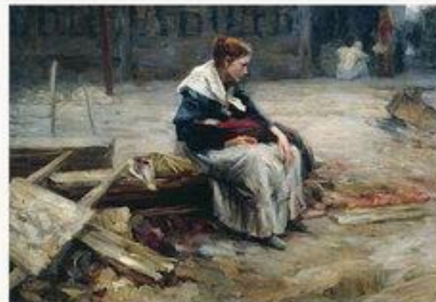
Жена заводского рабочего