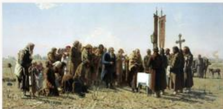
«Молебен во время засухи»