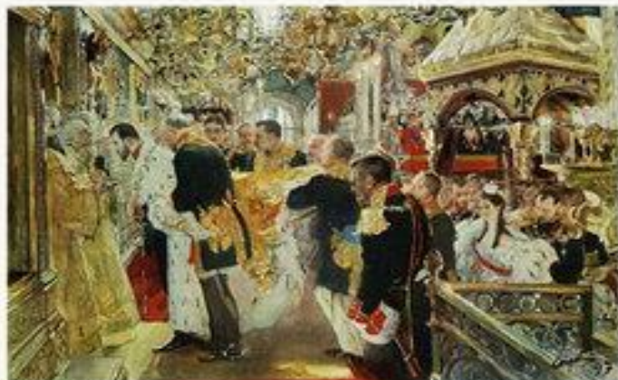
«Миропомазание императора Николая Александровича» 1897