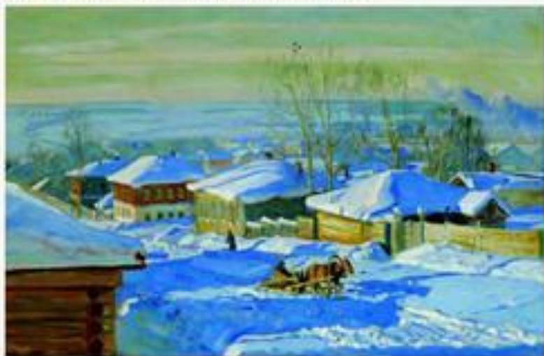
«Зима» 1915 г.