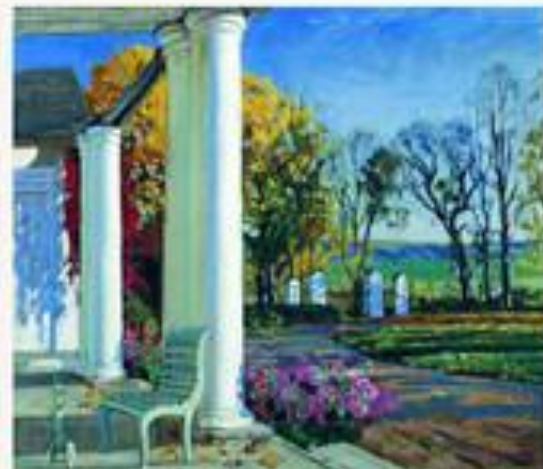
«Осеннее утро» Середина 1920-х.