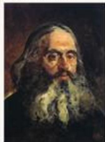
Голова апостола Андрея