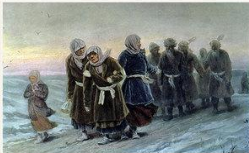
Возвращение крестьян с похорон