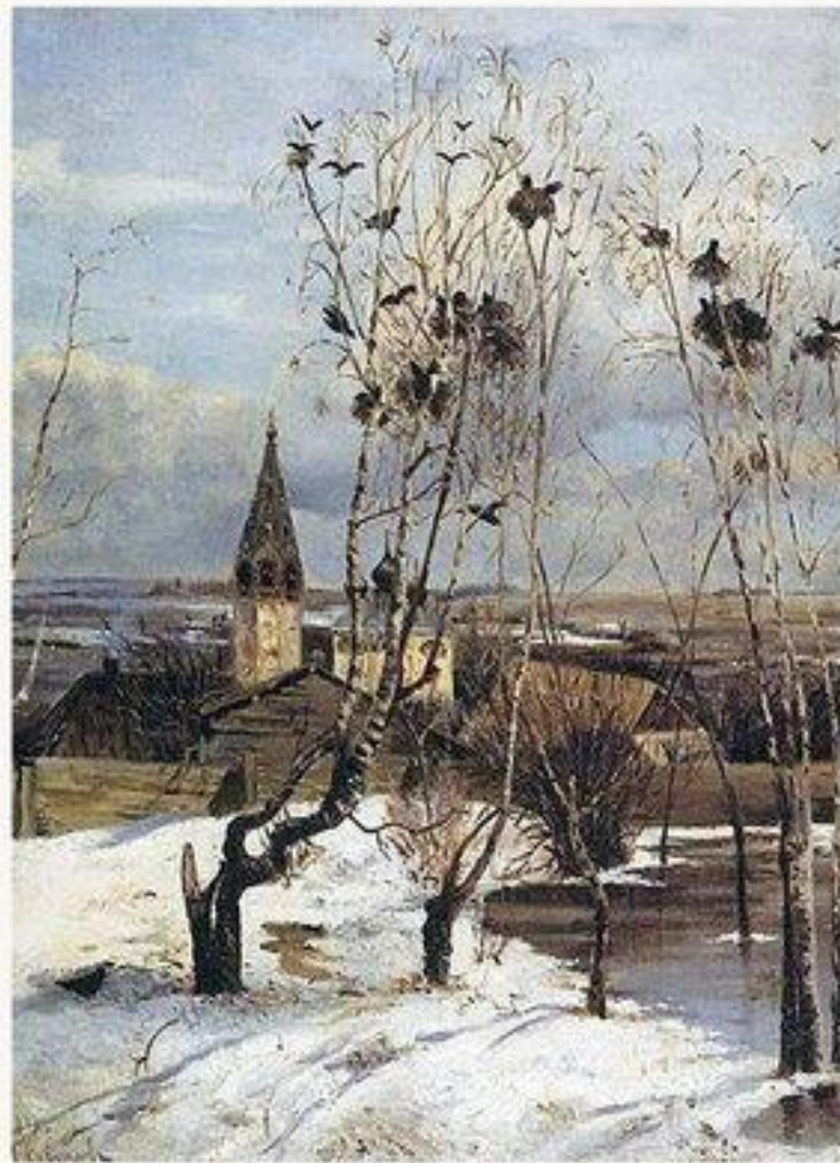
Грачи прилетели. 1879