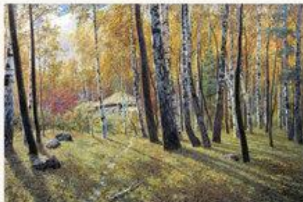
«Осень в лесу»