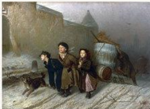
«Тройка». Ученики-мастеровые везут воду»