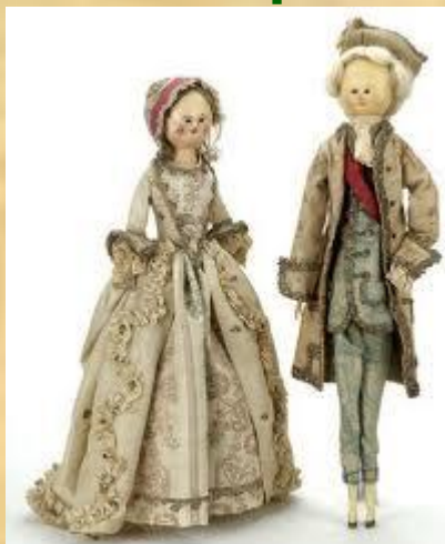
Пандора императрицы Марии Федоровны

Повсюду роскошно одетые куклы служили глашатаями и законодателями мод, прежде чем появились модные журналы