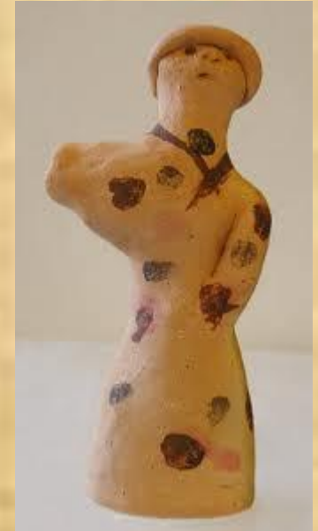
Россия 10 век