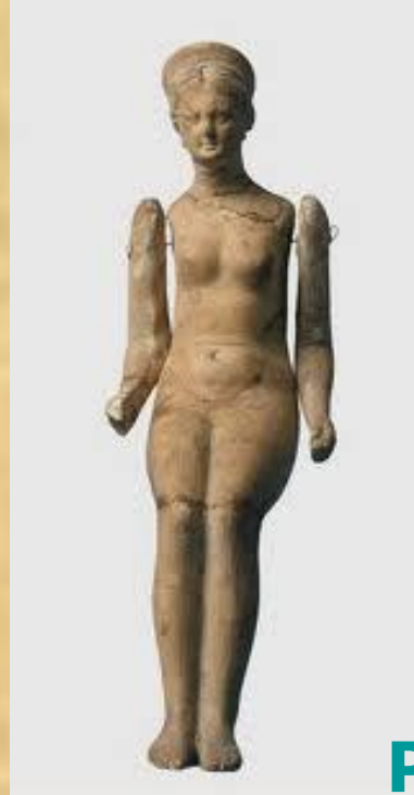
Греция 440 г. новой эры

Всюду, где селится и живет человек, кукла — неизменная его спутница