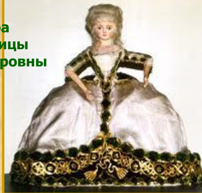
Пандора императрицы Марии Федоровны

Повсюду роскошно одетые куклы служили глашатаями и законодателями мод, прежде чем появились модные журналы