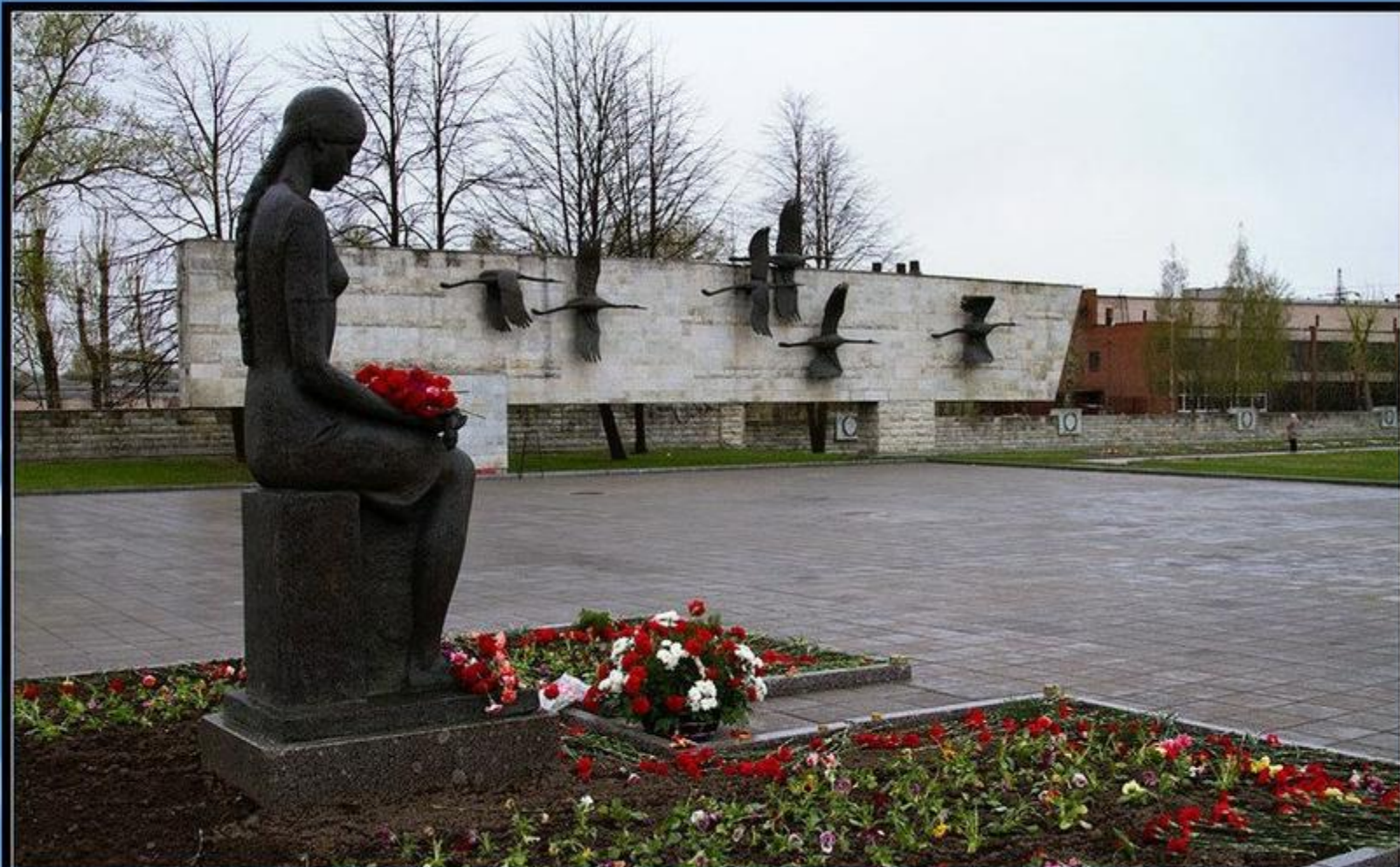
Санкт-Петербург . Невский мемориал «Журавли». Открыт в 1980 г.