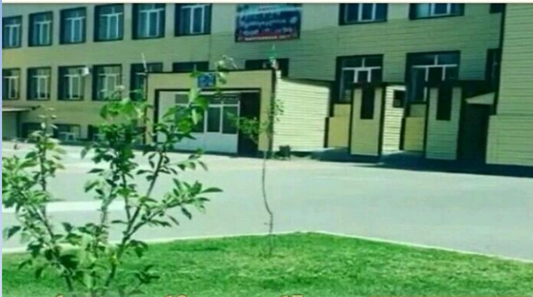
МБОУ «СОШ№ 1 с.п. Надтеречное»