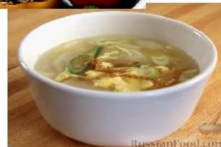
Хве (суп из курицы)