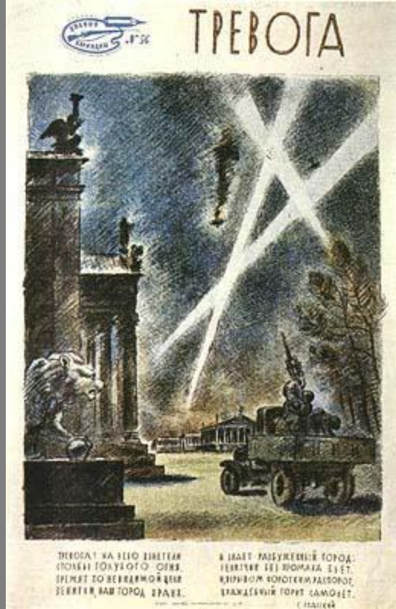
По плакатам того времени можно изучать историю.

ТРЕВОГА! НА ЗЕМО ВРАГЕТАМ СТОЯТ ГОЛУБОГО - СЕНА, ЗРЕМЕТ ДО ВЕРКАМОН ЦЕМ ЗЕВНЕМ, НАВ ГОРОД, ВРАГЕ.