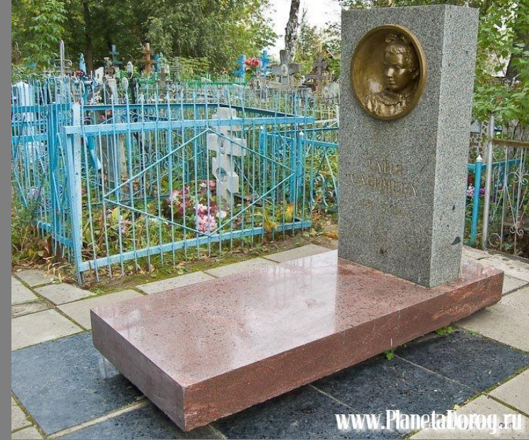
Могила Тани Савичевой в Поволжье