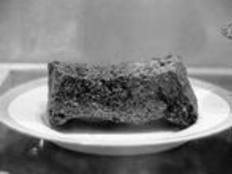
Дневной паек хлеба в блокадном Ленинграде

И часто я ловлю себя на том, Что если б все куски поднять из пыли, Попали бы они голодным людям в дом И сколько б жизней сохранили