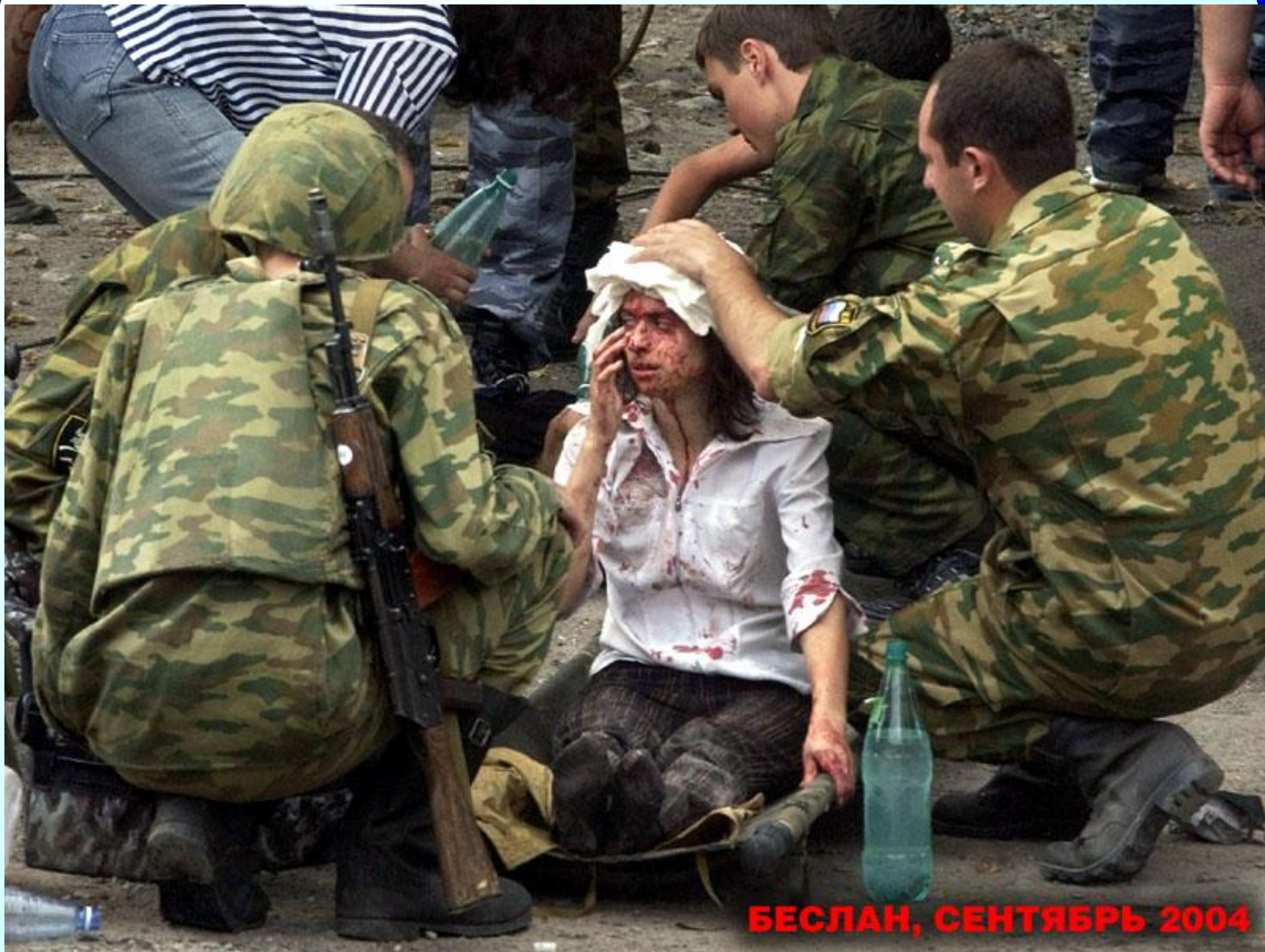
БЕСЛАН, СЕНТЯБРЬ 2004