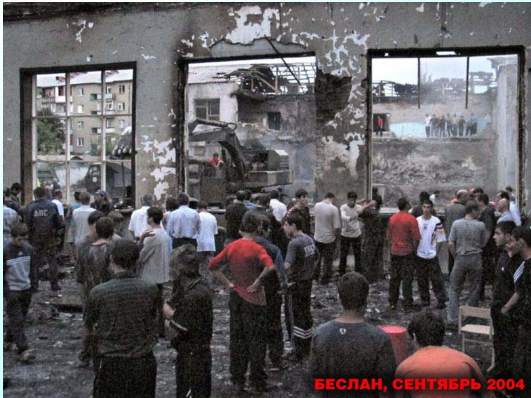
БЕСЛАН, СЕНТЯБРЬ 2004