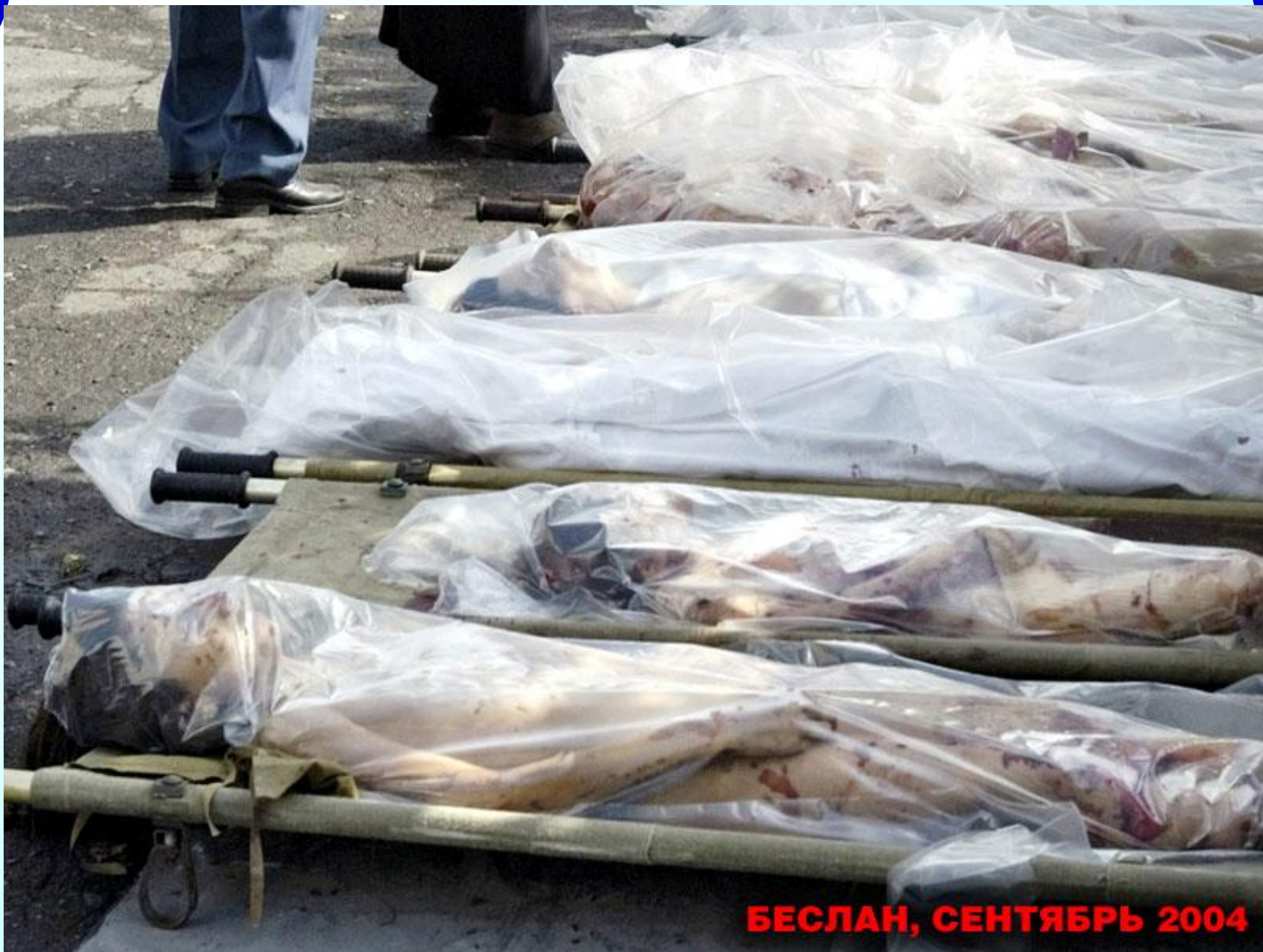
БЕСЛАН, СЕНТЯБРЬ 2004