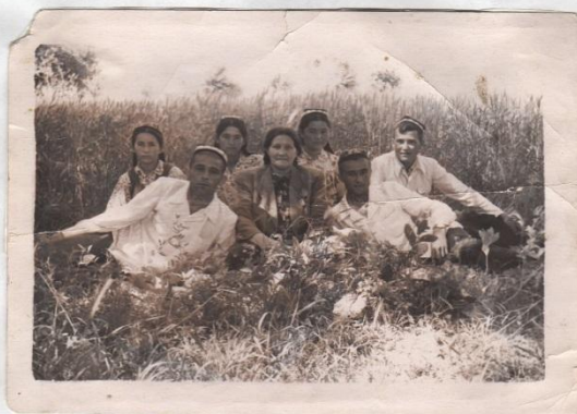
Ўзбәкстан. Нурлыхода укучылар арасында