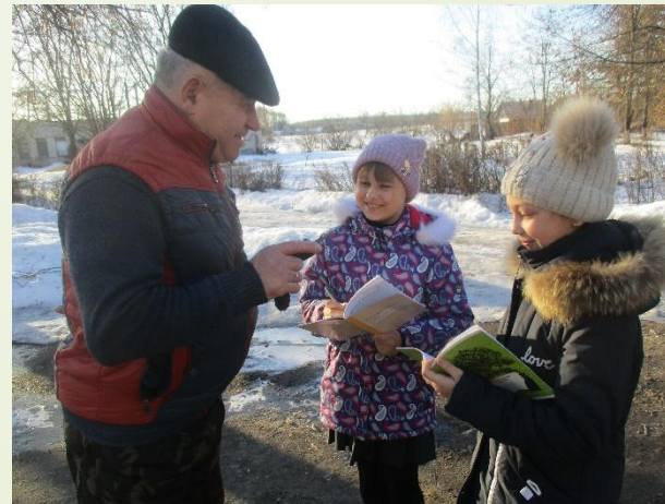
Интервью с жителями села