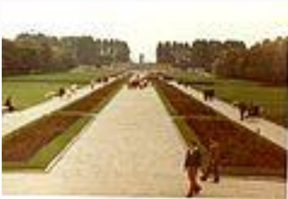
Пискаре́вское мемориальное кладбище