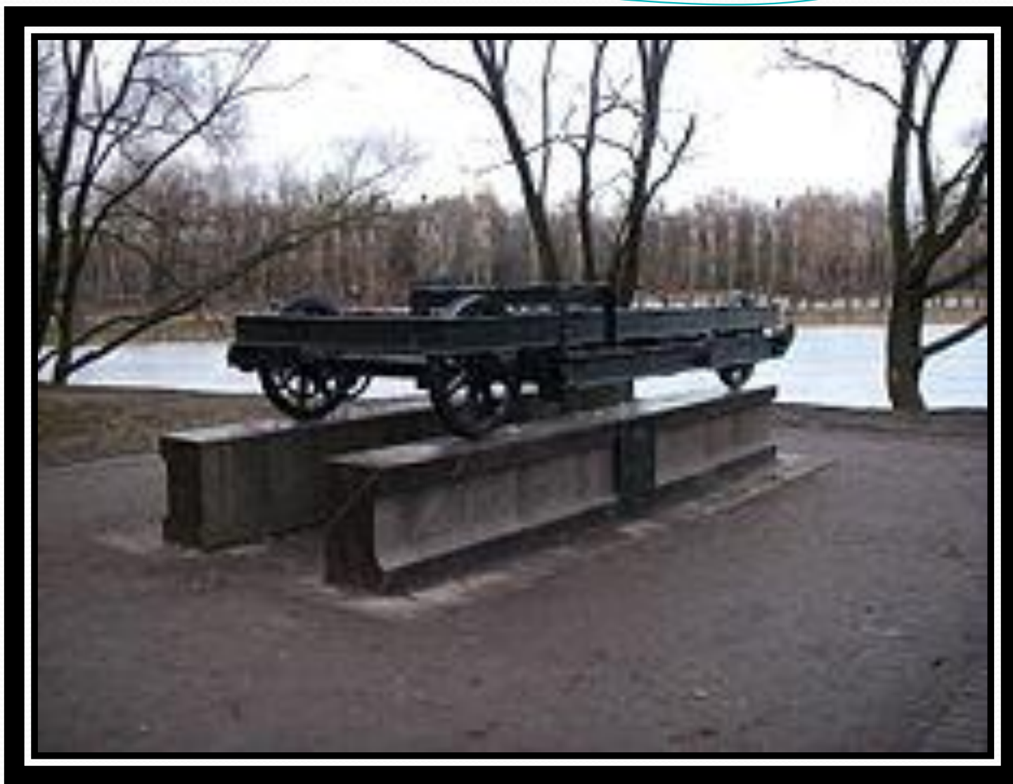
Памятный знак «Вагонетка»