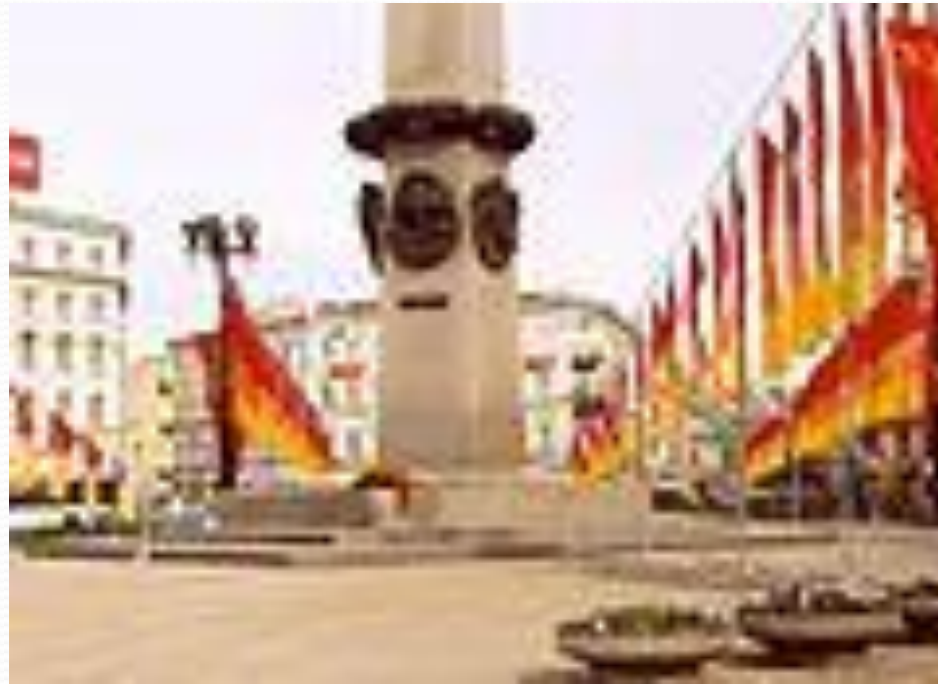
Обелиск «Городу-герою Ленинграду»