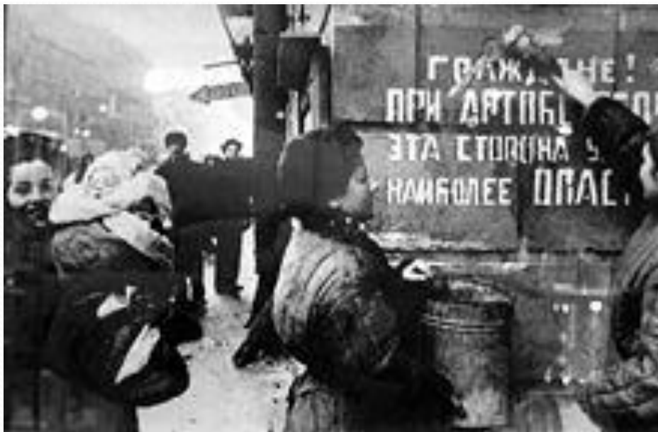
Ликующий Ленинград. Блокада снята, 1944 год