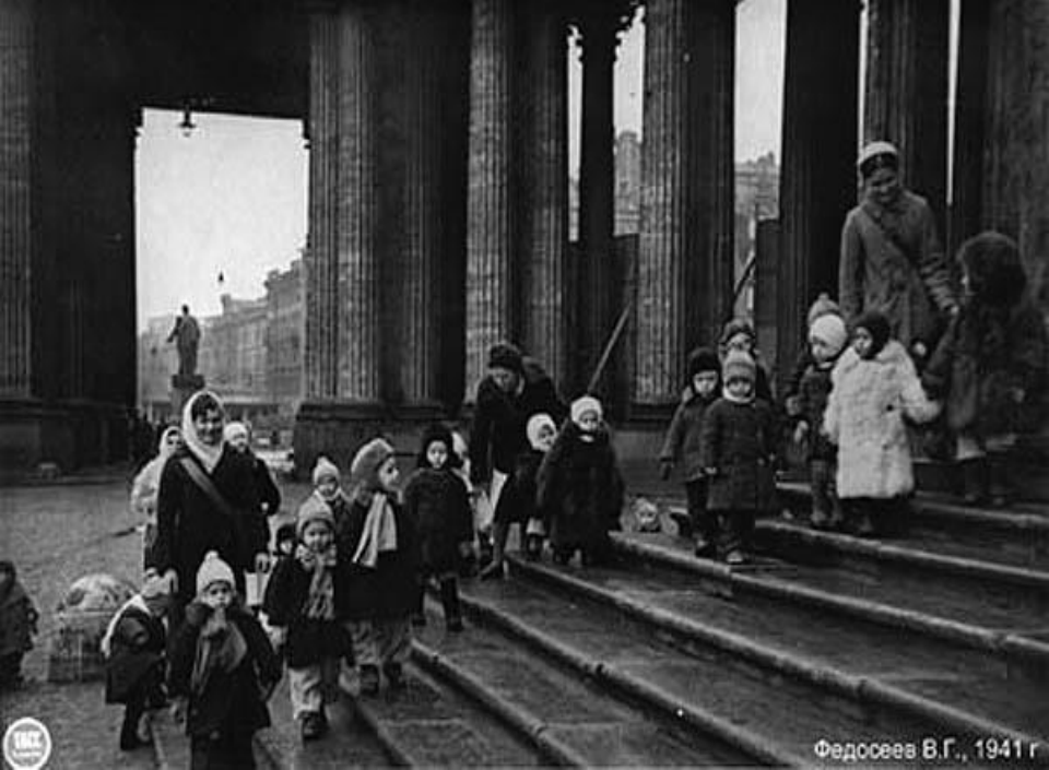
Федосеев В.Г., 1941 г.