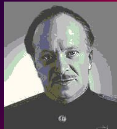
Лебедев-Кумач Василий Иванович