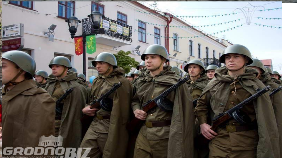
24 июня 1945г. на Красной площади прошёл Парад Победы. Проведение парада стало традицией, его проводят во многих городах каждый год 9 мая.