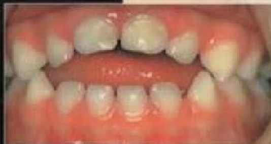
Открытый прикус во фронтальном отделе: ротовое дыхание и дефекты речи.