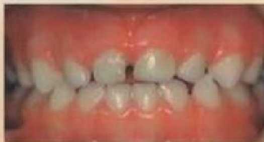
Саморегуляция после устранения вредной привычки сосания пустышки с помощью вестибулярной пластинки.