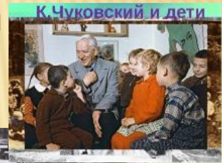
К. Чуковский и дети