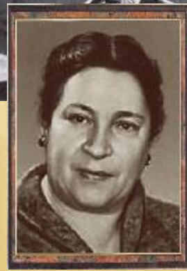
А.Л.Барто Одна из самых известных и любимых детских поэтесс. Автор стихов как для самых маленьких, так и для детей среднего возраста. Всем знакомы её героини: Таня, Зина, Любочка, Тамара.