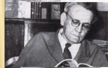
Самуил Яковлевич Маршак 1887 - 1964