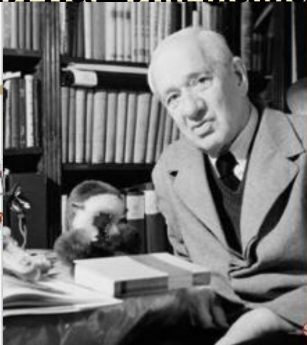
Чуковский Корней Иванович критик, писатель, литературовед, доктор филологических наук.