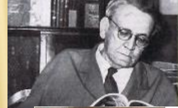
Самуил Яковлевич Маршак 1887 - 1964