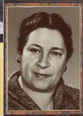
А.Л.Барто Одна из самых известных и любимых детских поэтесс. Автор стихов как для самых маленьких, так и для детей среднего возраста. Всем знакомы её героини: Таня, Зина, Любочка, Тамара.