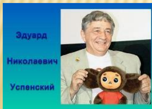
Эдуард Николаевич Успенский