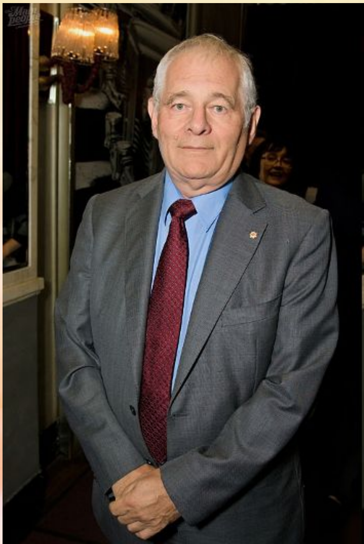
Рошаль Леонид Михайлович