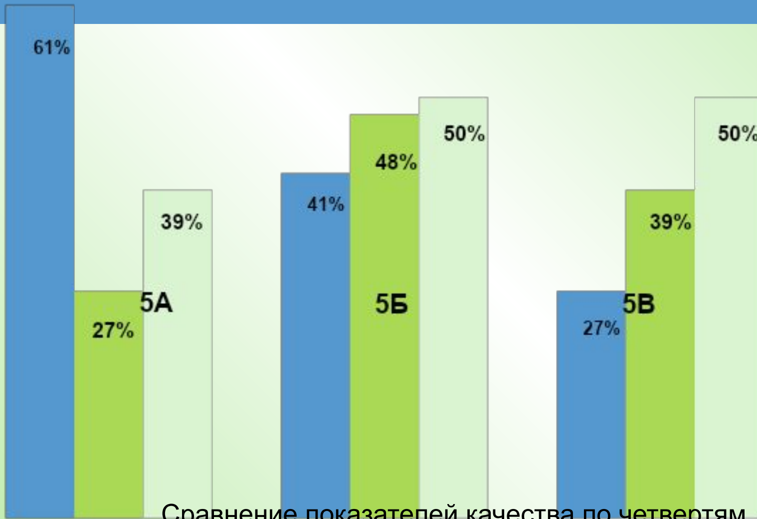
Сравнение показателей качества по четвертям