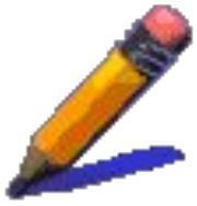
СХЕМА ПОЛНОГО АНАЛИЗА УРОКА