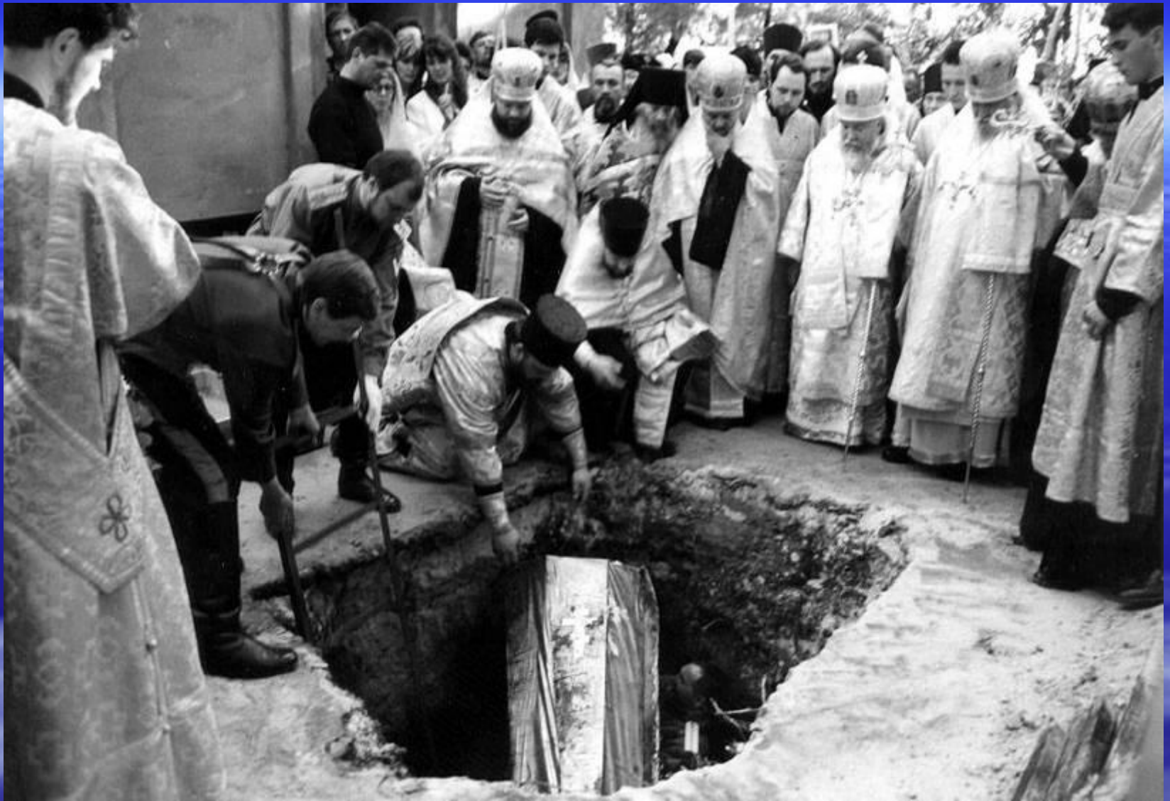
Обретение мощей святого блаженного Андрея 3 июня 1998 года.