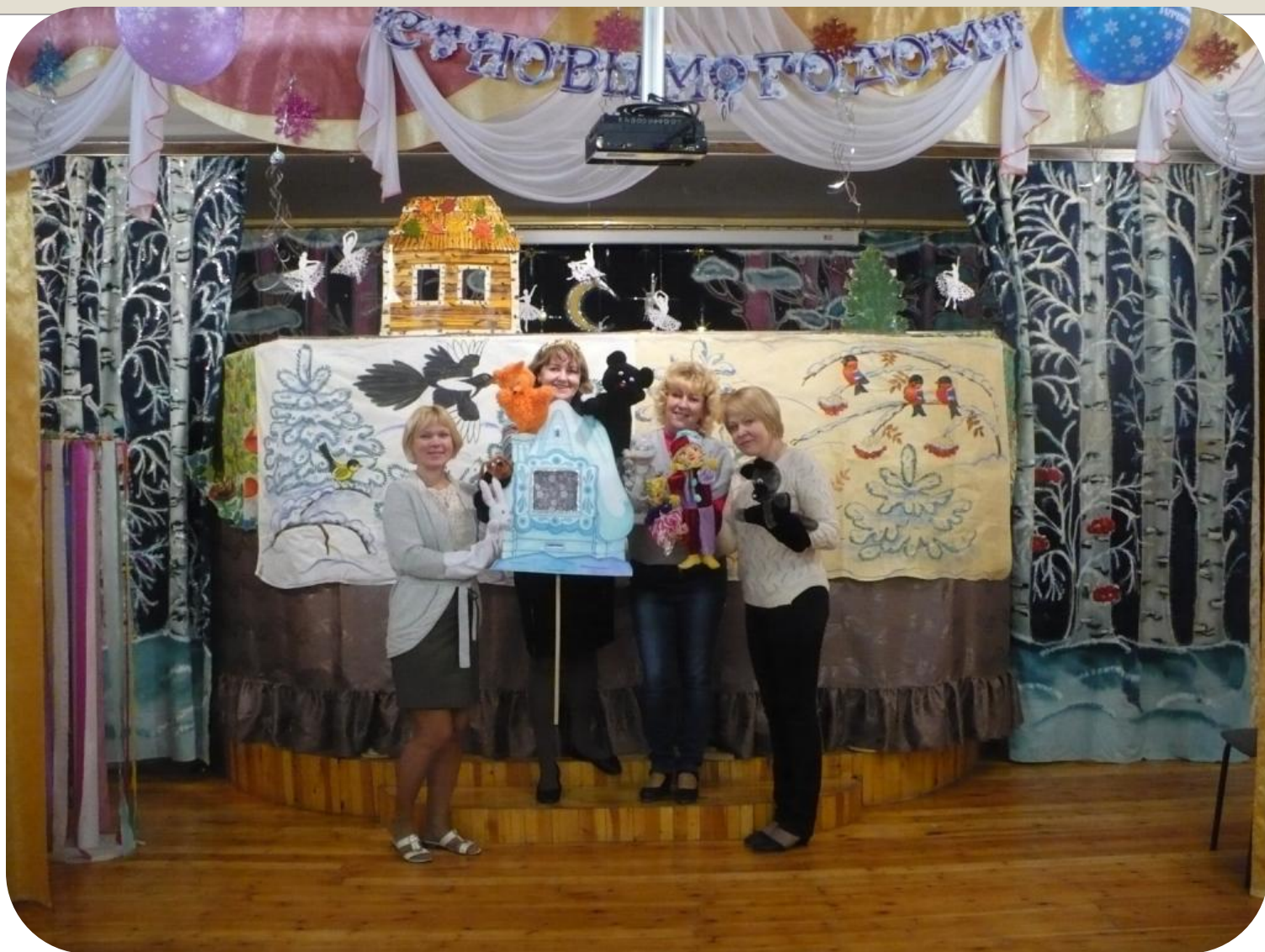
Кукольный спектакль «Заюшкина избушка»