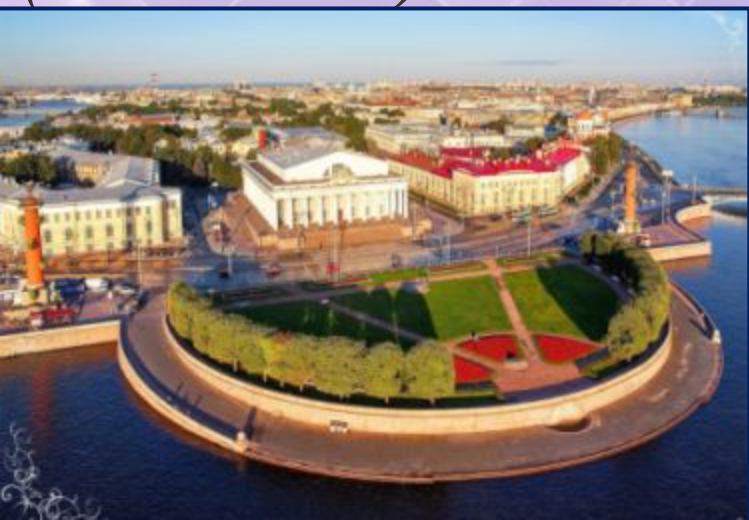
«Стрелка Васильевского Острова» («Лопатка»)