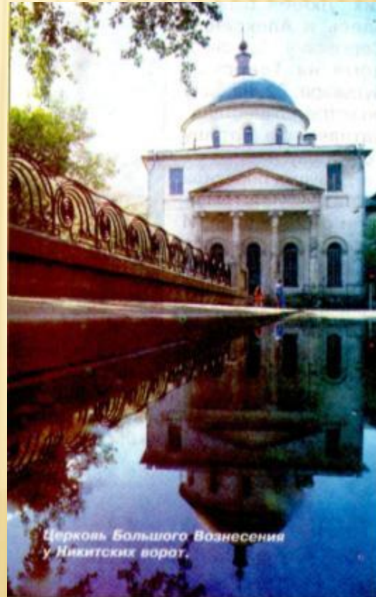
Церковь Большого Вознесения у Никитских ворот.