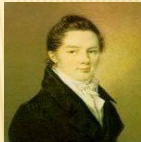
Иван Иванович Пуцин

Пушкин сохранил лицейскую дружбу и культ Лицея на всю жизнь.