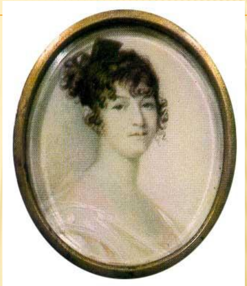
Н.О. Пушкина. 1800-е гг.