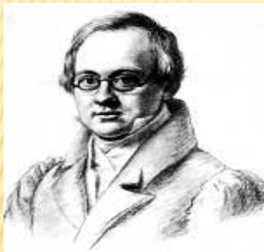
Антон Антонович Дельвиг