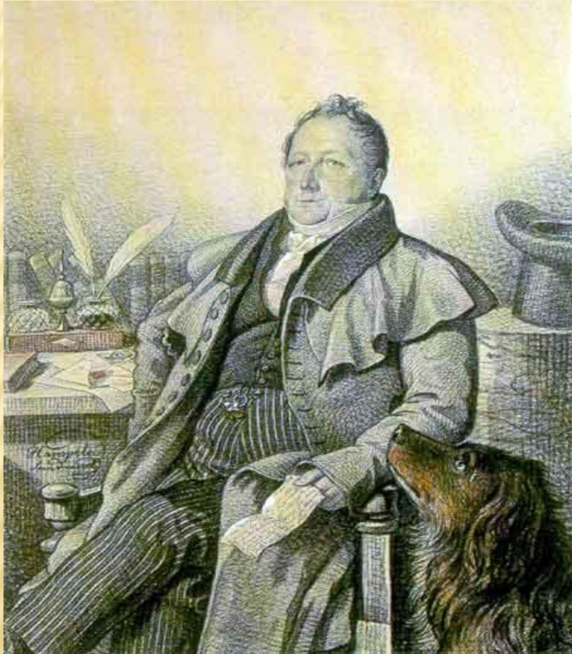
С.А. Пушкин. 1824.