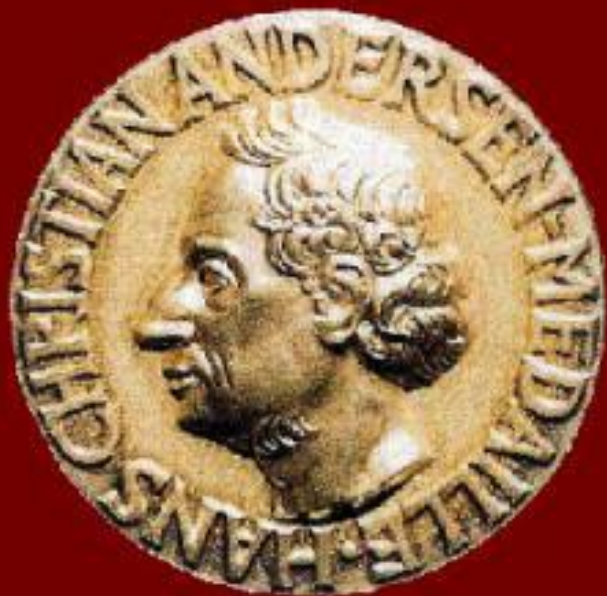
Hans Christian Andersen Medal

Творчество Астрид Линдгрен было отмечено многими престижными литературными наградами. В 1958 году она была удостоена медали Ганса Христиана Андерсена